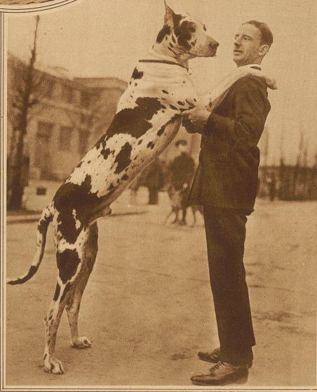
Prachtexemplar einer blau-weißen deutschen Dogge

(Aus Madras wird berichtet, daß unter den Kulis in ganz Südostasien die Trinkgewohnheiten im letzten Jahr außerordentlich rasche Fortschritte gemacht haben. Das populäre Getränk jener Gegend ist noch immer gegorener Palmwein, und es ist immer mehr üblich geworden, in den großen Plantagen besondere Palmenanpflanzungen zu reservieren, die ausschließlich das Getränk für die arbeitenden Kulis zu liefern haben. Die Tagesarbeit beginnt dann in der Regel mit dem Anzapfen der Palmen und dem Abfüllen des Saftes in Ochsenhäute, in denen er bis zum Abend ragt. Viele Kulis verbrauchen von ihrem durchschnittlichen Tagelohn von 2 Schill. 3 d nicht weniger als 1 1/2 Schill. für Palmwein.