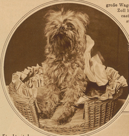
Ein chinesisches Pinscherchen, das sich seiner Schönheit voll bewußt ist

Auch ein Wettrennen, das im Eiffelturm abgehalten wurde, ist noch nicht lange her. Es