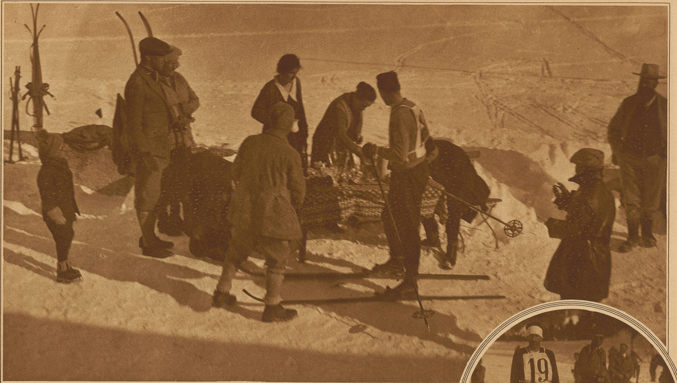
Zwischenverpflegung beim obligatorischen Erfrischungshalt in Berninahäusern