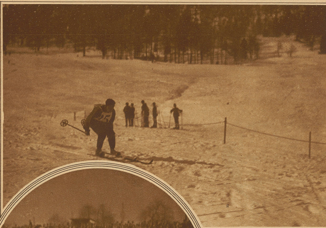
Unterwegs, dem Ziel entgegen