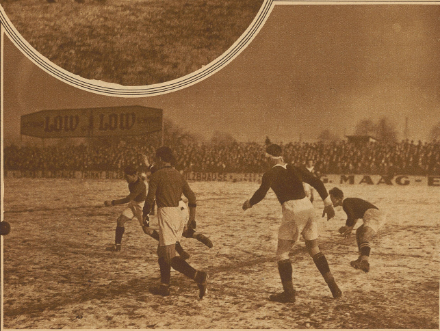
Kampfmoment vor dem Tor Luganos