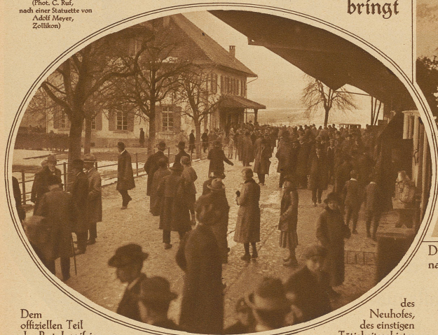
Dem offiziellen Teil der Pestalozzifeier schloß sich eine Besichtigung