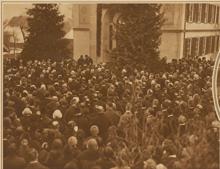
Die Festgemeinde hört die Ansprache des aargauischen Erziehungsdirektors, Reg.-Rat Studler, vor Pestalozzis Grab in Brugg