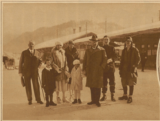
Dr. LUTHER, ehemaliger deutscher Reichskanzler, bei seinem Kuraufenthalt in St. Moritz