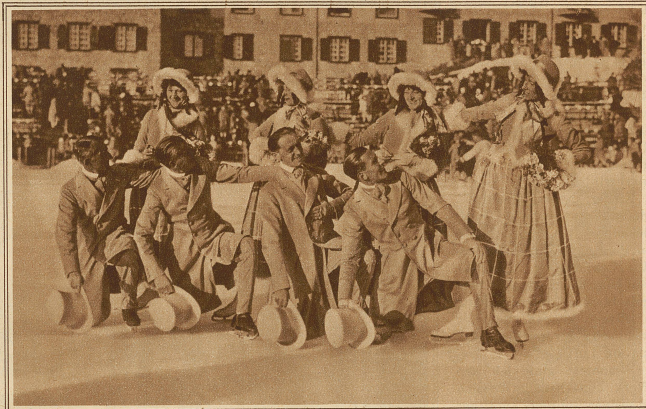
Biedermeier-Quadrille am Liefest des Suretta-Hauses in St. Moritz