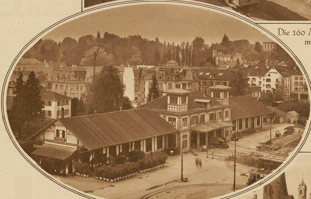
Blick auf das alte, dem Abbruch geweihte Aufnahmegebäude Zürich-Engse