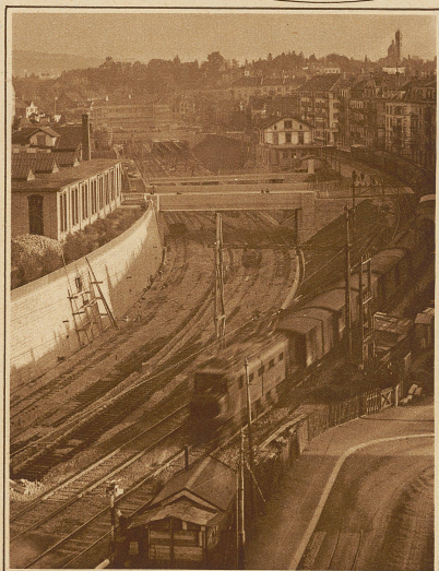
Unterführungsbauten beim neuen Bahnhof Wiedikon, der als Reiterbahnhof über die Geleiseanlagen gebaut wurde