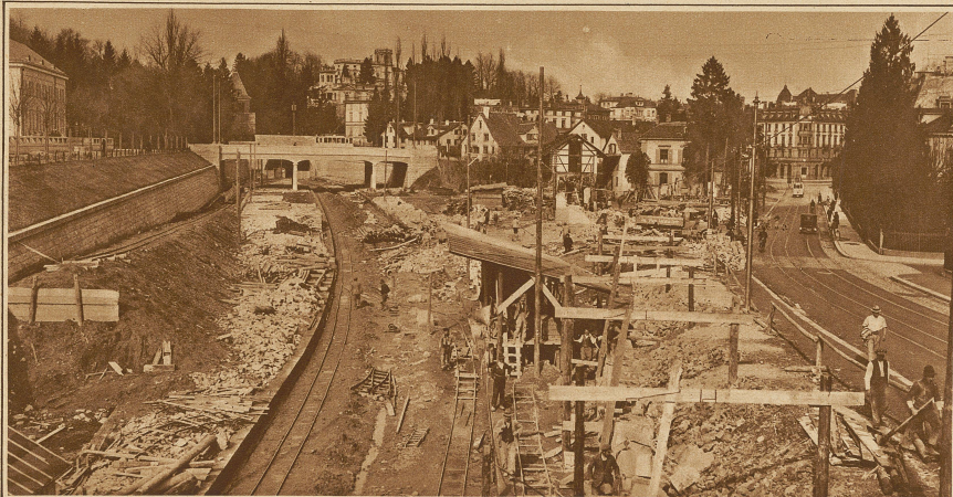
Die Arbeiten für die Anlage der neuen Station Engse. Rechts die Seestraße, längs welcher einige Häuser niedergelegt werden mußten, um Platz für den Neubau zu schaffen. Links hinten die Ueberführung der Bederstraße, dahinter der neue Ulmerstunnel nach der Station Wiedikon