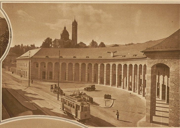
des neuen Bahnhofs Engse