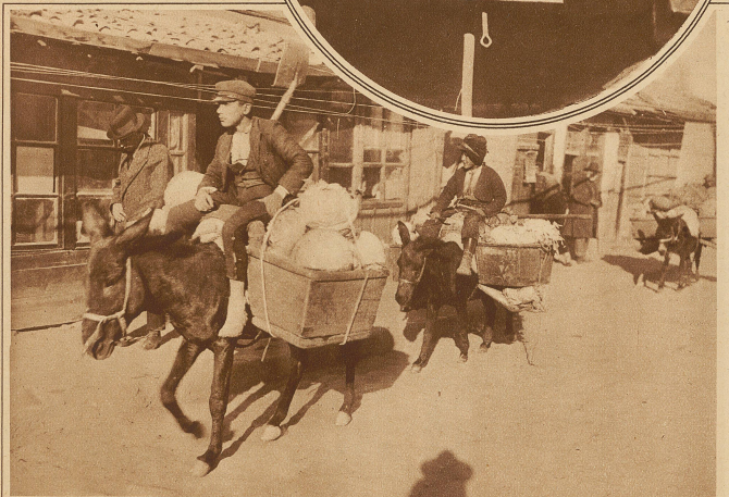
Obsthändler in den Straßen Angoras

auch auf ihrem Tagesprogramm. Nun keine trennende Hülle mehr Luft und Licht von es diese, die die Abschaffung des Schleiers am meisten bedauern.