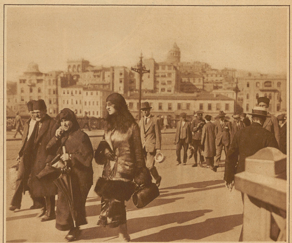
Auf der Galata-Brücke in Konstantinopel.

Die nach der neuesten Mode gekleidete Türkin mit dem nach Fallen des Schleiers gebräuchlichen Kopftuch; ihre Mutter zur Seite in der türkischen Tracht mit zurückgeschlagenem Gesichtschleier und dem modernen Regenschirm. Im Bilde sind noch alle drei Kopfbedeckungen (Fez, Filz- und Strohhut) zu sehen