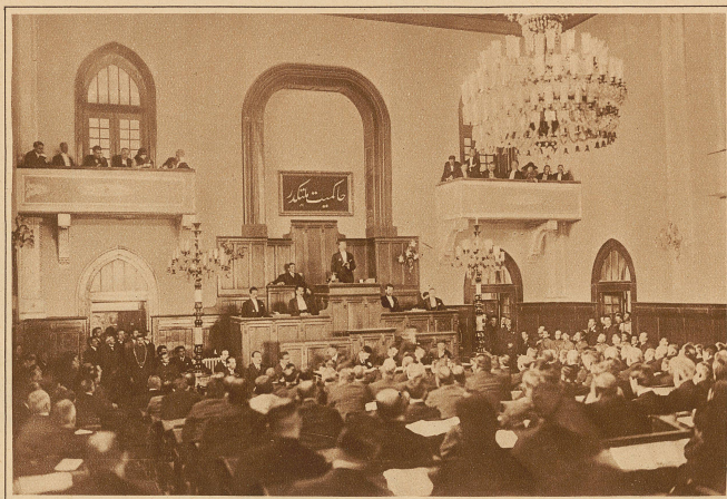
Kemal Pascha im Parlament bei der Festsetzung am Jahrestage der türkischen Republik

Auf das häusliche Leben, auf die Stellung der Frau in der Familie und in der Öffentlichkeit sind diese Umwälzungen naturgemäß von gewaltigem Einfluß gewesen. Der geheimnisvolle Zau-