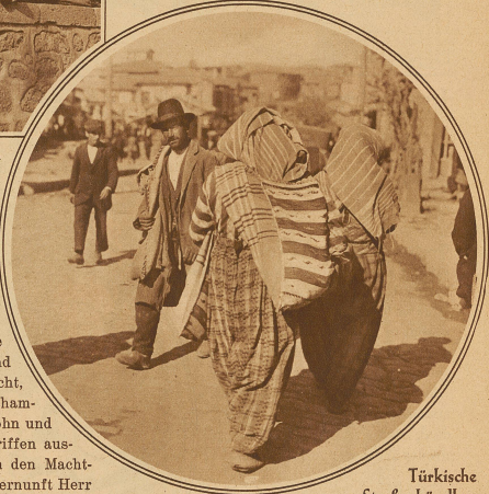
Türkische Straßenhändler, die im Straßenleben Angoras lebhafteste Kontraste hervorrufen