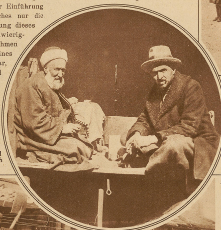
Neben dem alten Händler, der wenigstens vorläufig noch am traditionellen Gewand festhält, ein moderner Händler, der sich der Neuzeit nicht verschließt

mit dem Abendlande, nur noch selten von ihrem Recht Gebrauch gemacht.