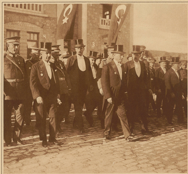
Führende Männer der modernen Türkei: 1. Djemil Bey, 2. Kemal Pascha, 3. Djenani Bey, 4. Ihsam Bey