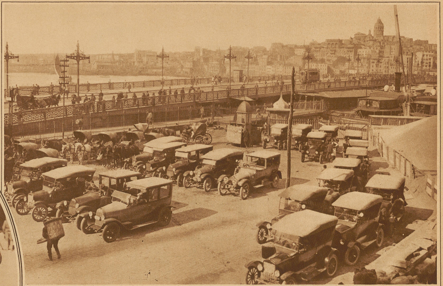
Das neue Gesicht Konstantinopels im Zeichen der Reformen Kemal Paschas. Man beginnt die Zeit zu schätzen und hat dabei den Vorteil des Automobils erkannt, das große Mühe hatte, sich einzubürgern

wegs glatt und ohne Schwierigkeiten vor sich gegangen, und es bedurfte und bedarf noch streng durchgeführter Gesetze, um die Zivillisation des Abendlandes auch auf diesem Gebiete