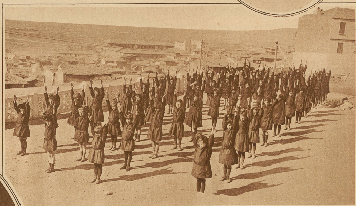
Die sportliche Ertüchtigung der türkischen Jugend. Mädchen turnen vor der Schule in Angora

auch auf ihrem Tagesprogramm. Nun keine trennende Hülle mehr Luft und Licht von es diese, die die Abschaffung des Schleiers am meisten bedauern.