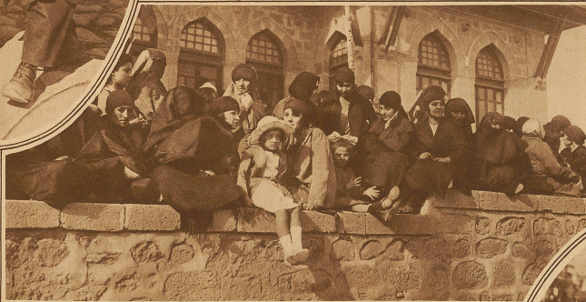
Die schöne Türkin. Dieses charakteristische Bild von Frauen vor dem alten Parlament in Angora zeigt, wie viel Schönheit der Schleier verborgen hat

Bei den Männern vollzog sich der gleiche Kampf um den Fez, nur noch harntäckiger, da