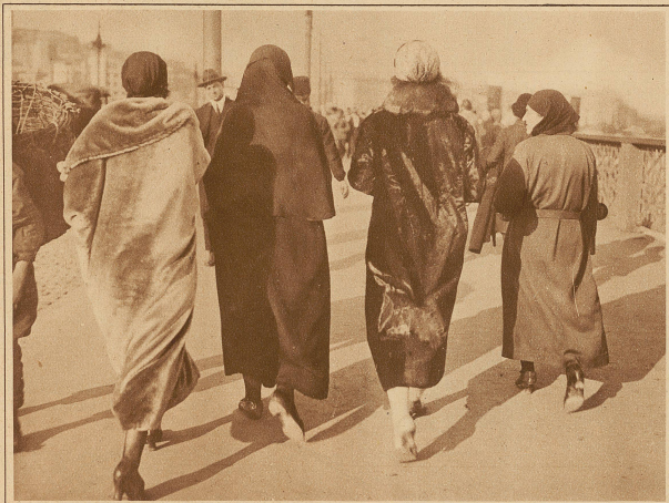
Typisches Momentbild auf der Galata-Brücke in Konstantinopel. Die Türkin kleidet sich in modernster Weise; einzig der Hut fehlt noch, der aber wohl auch bald Eingang finden dürfte

ber der Harems existiert nicht mehr. Auch hier hat Kemal Pascha tiefgreifende Bestimmungen getroffen, die dem Türken seit der Einführung des schweizerischen Zivilgesetzbuches nur die Eine gestatten. Die Durchführung dieses Gesetzes hat auf weit weniger Schwierigkeiten gestoßen, als man anzunehmen berechtigt war. Da die Haltung eines Harems lediglich eine Geldfrage war, verbot es sich in dem größten Teil der Bevölkerungsschichten von selbst, mehrere Frauen zu heiraten. Die vornehmen Kreise der besitzenden Klassen aber haben, dank ihres höheren Bildungsgrades und des engeren Kontaktes