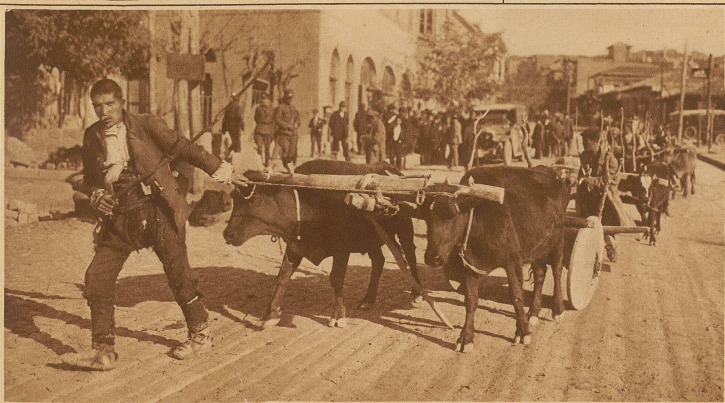
Ein Bauer in den Straßen von Angora