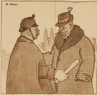
«Verzeihung Herr Schussmann, ich möchte gerne irgendwo ein Glas echtes Münchner trinken!» «Ich han absolut nit degäse... gönd Sie doch!»

Deutlich. Fremder: «Ich lese da soeben, daß es den Angestellten verboten ist, Trümpfegelder zu fordern!» Portier: «Natürlich; ein verständiger Mensch gibt ja auch, ohne daß ihm etwas abgefordert wird!»