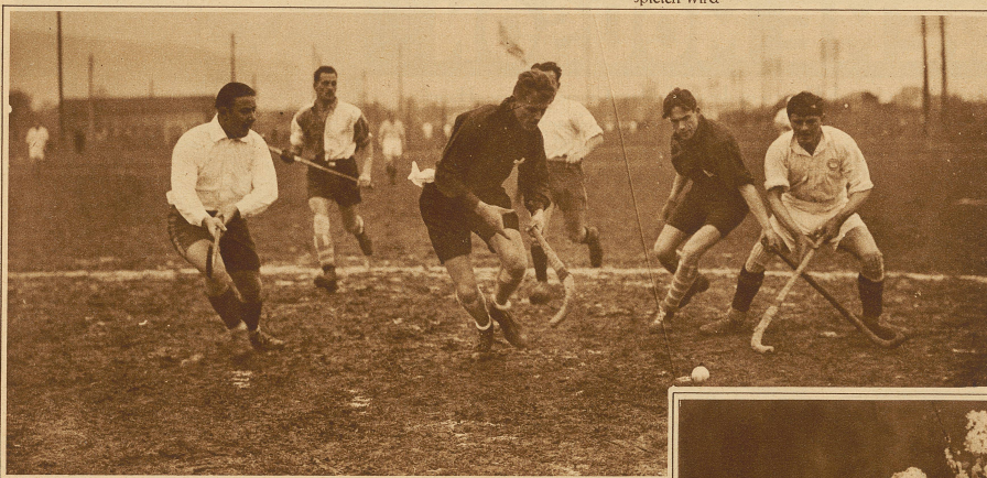
Ein rassistiger Angriff des weißen Sturmes