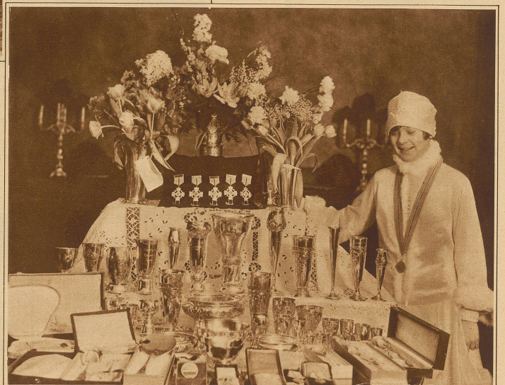
Sonja Henie, Oslo, die erst 15 jährige Weltmeisterin im Eiskunstlaufen, mit ihren wertvollen Preisen