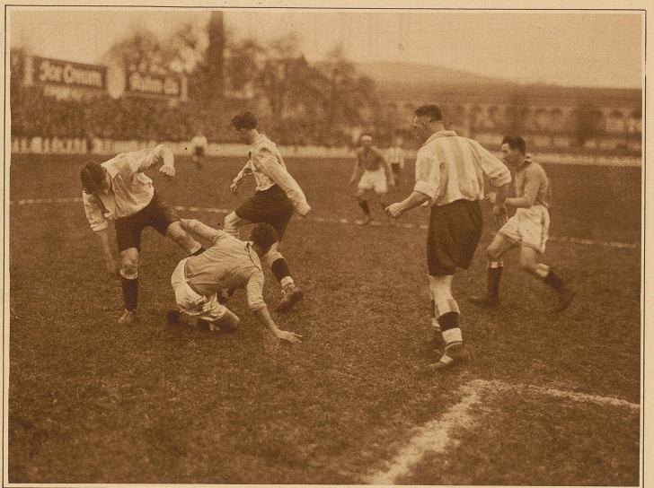
Kritische Situation vor dem Tor des F. C. Zürich