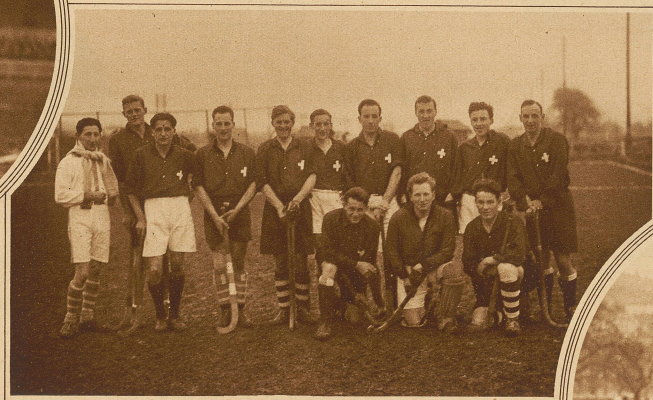
Die nach dem Spiel formierte Mannschaft, die am 26. März gegen Belgien spielen wird