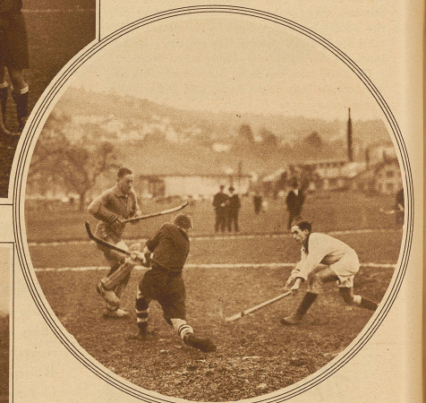
Die rote Verteidigung bei der Abwehr

Das Auswahlspiel der Hockey-Nationalmannschaft in Zürich