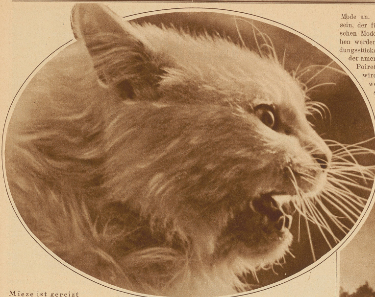
Mieze ist gereizt