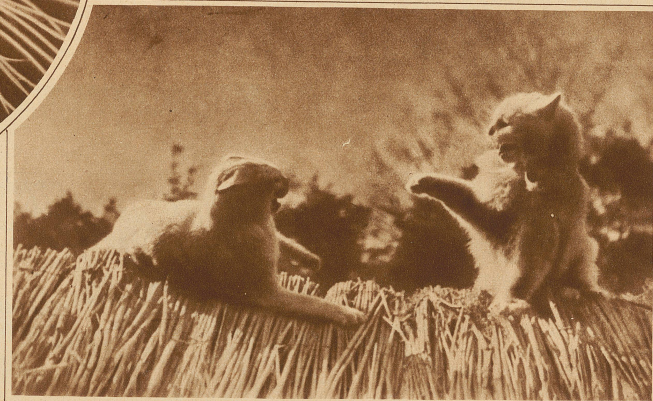
In stiller Mondscheinnacht....

Frauen, die sich heute noch weigern, das goldene Vließ ihrer Haare auf dem Altar zu opfern, bald von jenen besiegt sein werden, die kühn zur Schere gegriffen haben, und daß die, welche allzulange zaudern, schließlich der Lächerlichkeit anheim fallen werden. Man wird dazu gelangen, auch die Hosens praktischer und gesünder zu finden als die bisherige Tracht. Selbst die Abendtoiletten werden einfach und streng werden.» Die Bilder, die dem Artikel beigegeben sind, zeigen uns diese Damen der nächsten Generation. «Eine kapriziöse Dame von 1957» stellt eine junge Frau in einem Hosensanzug dar, mit Pelzbesatz an den Ärmeln und an den Fußknöcheln, während auf einer zweiten Abbildung das Modell einen sehr kurz geteilten Rock aufweist, den lange Gamaschen ergänzen, so daß die Dargestellte viel Ähnlichkeit mit einem Schafhirtin des 18. Jahrhunderts zeigt.