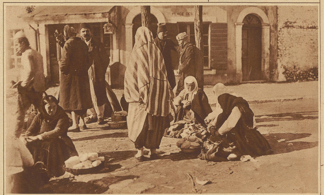
Szene auf dem Markt in Tirana