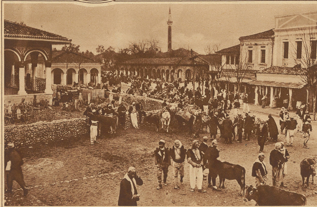
Auf dem Hauptplatz in Tirana, der meistgenannten Stadt Albaniens