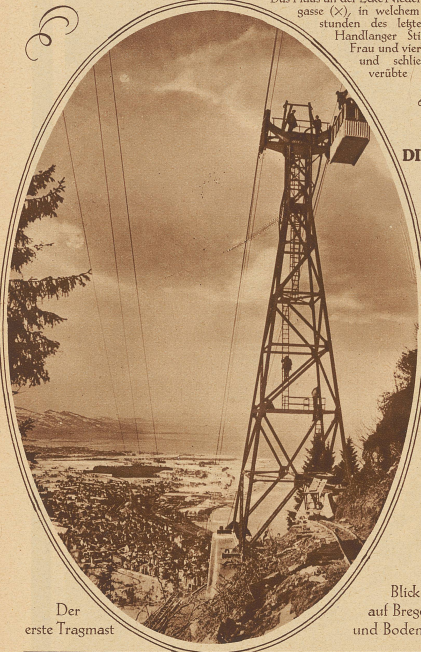
Der erste Tragmast