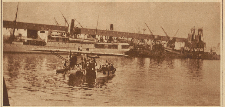
Mittelholzer am Ziel. Mit dem gleichen Schiff, das Mittelholzer wieder in die Heimat zurückbrachte, singen uns von einer eifrigen Leserin diese beiden Aufnahmen aus Kapstadt zu, die seine dortige Landung und die Einbringung der «Switzerland» in den Hafen im Bilde festhalten