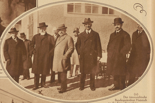
(X) Der österreichische Bundespräsident Hainisch an der Einweihungsfeier

Diese erste Seilschwebbahn im Bodensegebiet führt von Bregenz auf die 1040 m hohe Pfänderspitze