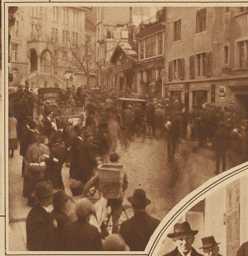
Die sensationlustige Menge wartet auf nähere Einzelheiten