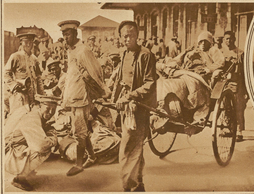
Verwundetentransport im Bahnhof von Shanghai