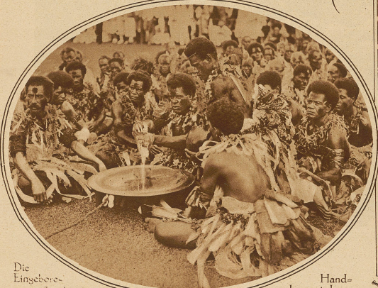
Die Eingebere- nen präparieren zu Ehren des Prin- zen eine Bowlle. Diese symbolische