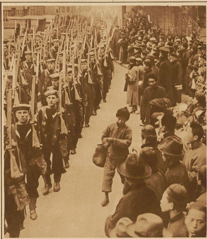
Britische Matrosen durchziehen eine der Hauptstraßen von Shanghai