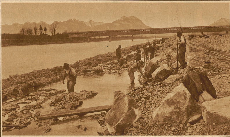
Erstellen des Damms auf dem Schweizerufer. An den Arbeiten sind gegenwärtig 250 Mann beschäftigt. Im Hintergrund die Brücke von Montlingen