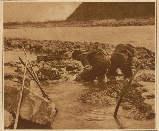
Mit Wasserhosen und Wasserstiefeln versehen, müssen die beschwerlichen Arbeiten im Wasser stehend verrichtet werden