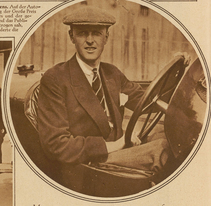
Major Seagrave, der bekannte englische Rennfahrer, erreichte am Dienstag auf der Piste von Dayton (Florida) mit seinem 1000- pferdigen Wagen eine Geschwindigkeit von 327 km in der Stunde