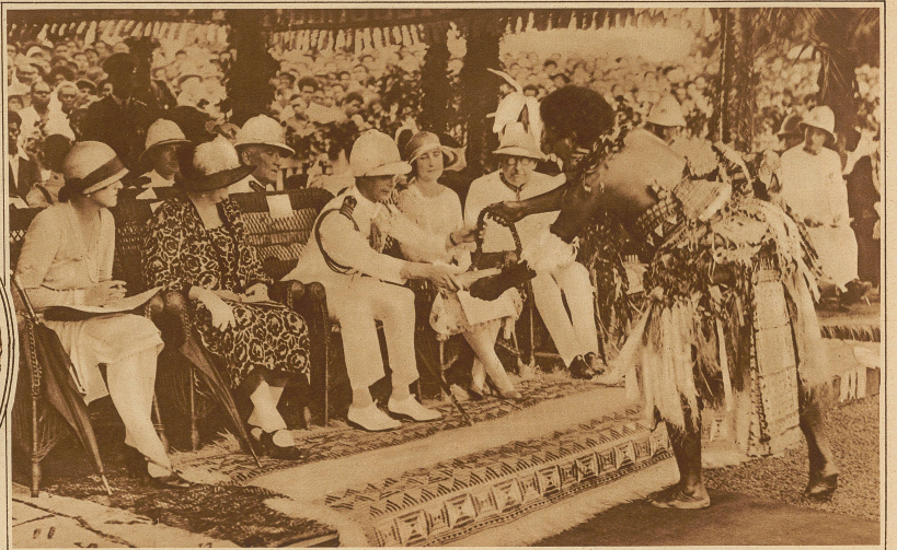
Besuch des Prinzen von York auf den Südseeinseln