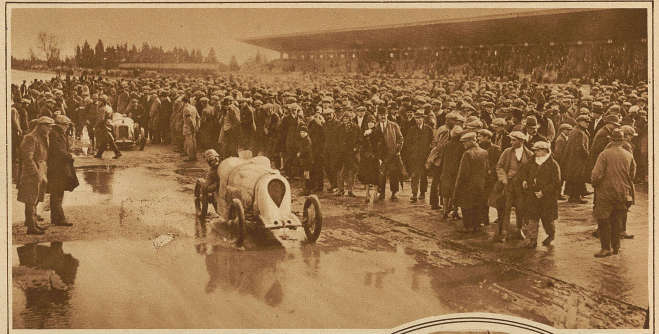
Das Publikum verhindert die Abhaltung eines Autorennens. Auf der Auto- rennbahn von Miramas bei Marseille sollte letzten Sonntag der Große Preis der Provence ausgetragen werden. Des schlechten Wetters und der so- fälligen Piste wegen erschienen nur 2 Wagen am Start und das Publi- kum, das sich so um die erwarteten großen Sensationen betrogen sah, drängte nach der ersten Runde in die Bahn ein und verhinderte die Weiterfahrt