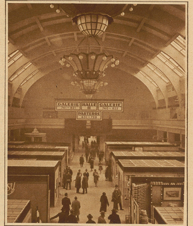
Blick in die Halle II