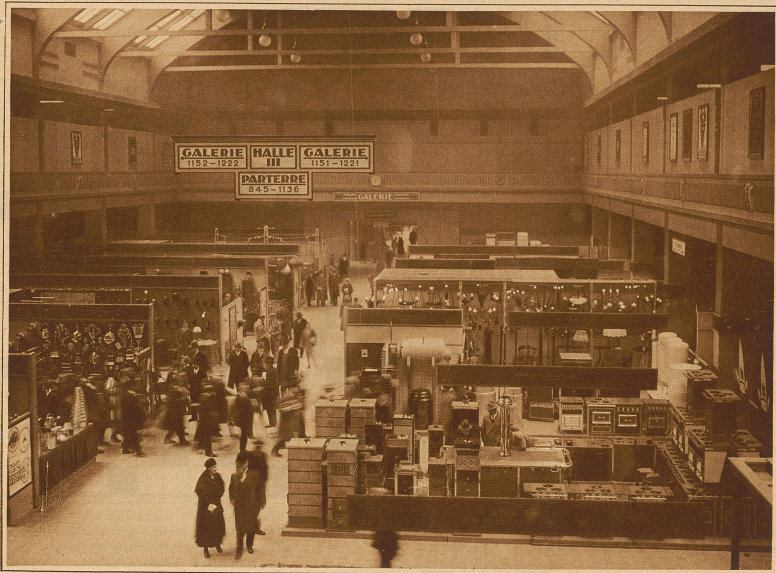
Die Halle III von den Galerien aus gesehen