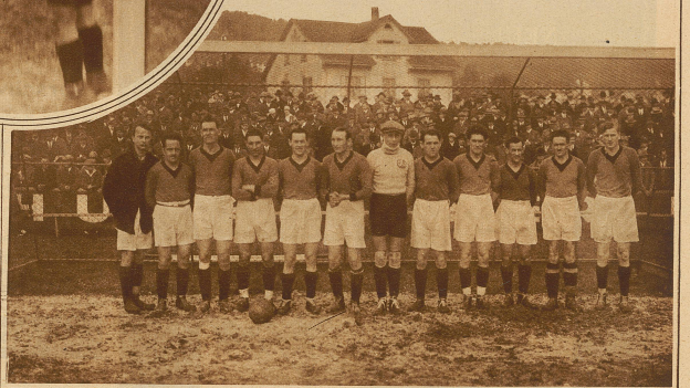
Die unterlegene Young Fellows-Mannschaft