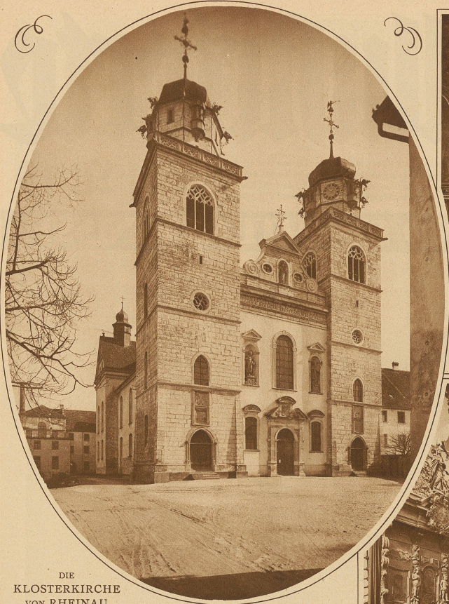
DIE KLOSTERKIRCHE VON RHEINAU