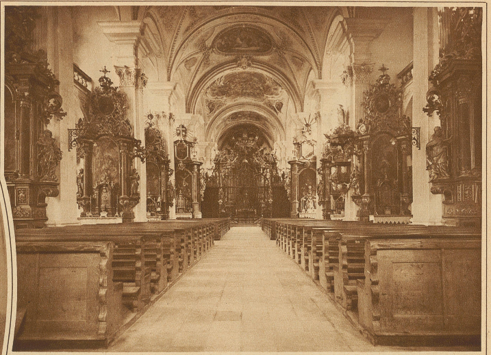
BLICK IN DAS HAUPTSCHIFF

Welfen gewesen sein. Das Kloster wurde im Jahre 925 durch die Hunnen überfallen und niedergebrannt, doch erstand um 1114 an seiner Stelle eine neue, im romanischen Stile gebaute Kirche, die dann um die Mitte des XVII. Jahrhunderts neuerdings einer Brandkatastrophe zum Opfer fiel. Das jetzige Münster, eine herrliche, 64 m lange und 18 m hohe Barockkirche, erbaute Abt Gerold II. Zurlauben, ein Zuger, in den Jahren 1705-1710. Als Architekt und Baumeister amtierte Franz Beer aus dem Bregenzwald, der auch die Abteikirche von St. Urban erbaute.