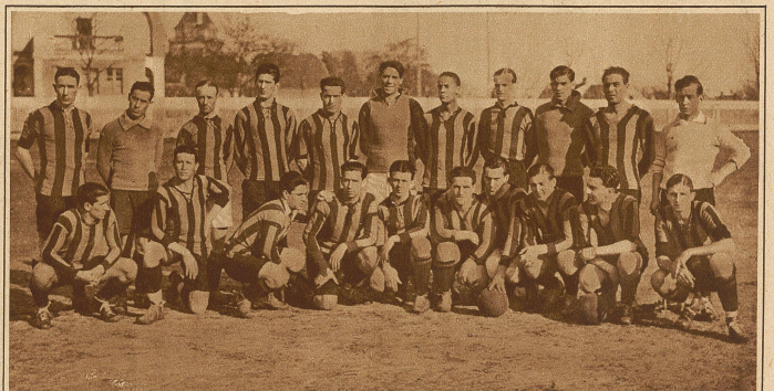
Die uruguayische Fußballmannschaft Penarol, die auf einer Tournee durch Europa begriffen ist, wurde am Sonntag von der Wiener Auswahlmannschaft 3:1 geschlagen