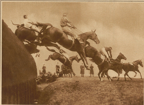
Enorme Hürden und Wassergräben gestalten das «Grand National Steeplechase», das alljährlich in England stattfindet, zum schwierigsten Hindernisrennen der Welt. Unser Bild zeigt einen Massensprung über eine große Hürde