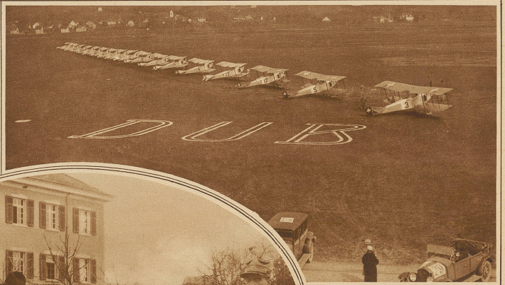
Die teilnehmenden Flugzeuge beim Start auf dem Flugplatz Dübendorf