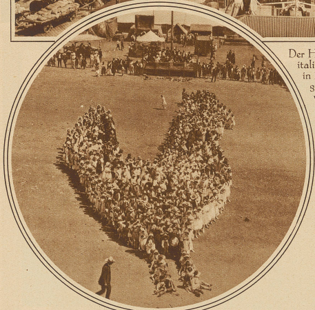
Nicht der Osterhase, sondern die Osterhenne, wurde auf diese originelle Weise durch amerikanische Schulkinder zur Darstellung gebracht