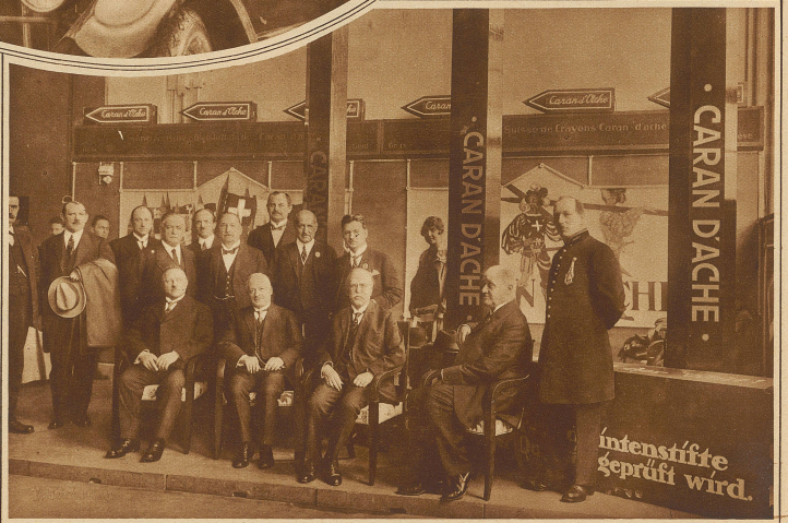
Bundespräsident Motta und Bundesrat Schulthess am offiziellen Tag der Basler Mustermesse