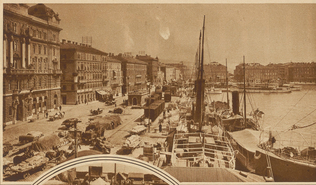
Der Hafen von Fiume, der nach dem italienisch-ungarischen Abkommen in Zukunft hauptsächlich dem ungarischen Außenhandel dienen wird