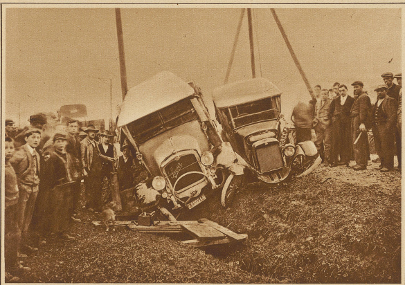
Beim Vorfahren mit geringer Geschwindigkeit fuhr auf der Zugerstrasse ein Personenwagen infolge Versagens der Steuerung seitlich in einen Sauerlastwagen hinein und schob ihn seitwärts in einen Graben hinunter. Personen kamen dabei glücklicherweise keine zu Schaden