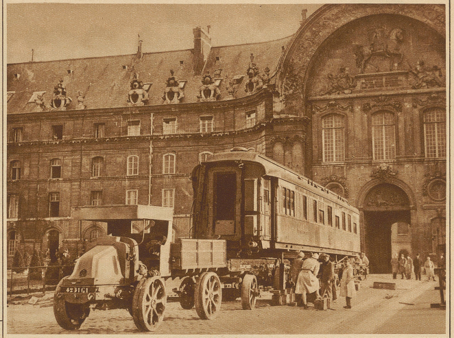
Der Salonwagen, in welchem seinerzeit der Waffenstillstand des Weltkrieges unterzeichnet wurde, wird nun aus dem Invalidendom wieder nach Rethondes bei Compiègne übergeführt, wo er auf der historischen Stätte aufgestellt werden soll