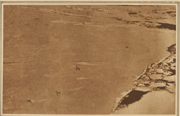
Der Nordpol mit den drei abgeworfenen Flaggen

Wir mäfligten unsere Geschwindigkeit und gingen bis auf 200 m hinunter. Während wir unbedeckten Hauptes standen,