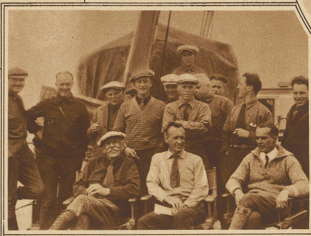
Die Mannschaft der «Norge»

keit genau festzustellen. Da das Eis unter uns von Nebel verdeckt war, konnten wir nämlich keine direkte Geschwindigkeitsberechnung vornehmen. Es war ganz klar, daß wir vorher eine zu große Geschwindigkeit errechnet hatten, wahrscheinlich, weil der Höhenmesser falsch zeigte. Nach den Radioangaben befanden wir