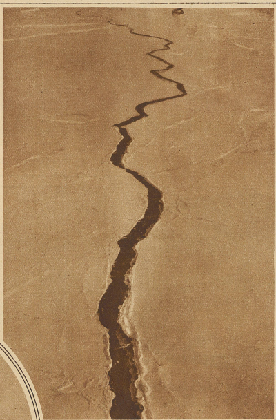
Die einzige große Eisspalte, die gesichtet wurde

Der Sonnenkompaß froz zu einem festen Eisblock von phantastischer Form ein und wurde unbrauchbar. Die vorstehenden Metallteile der Motorgondeln bedeckten sich mit Eis. An den Drahtseiltakeln setzten sich Rauhfrost-Kristalle