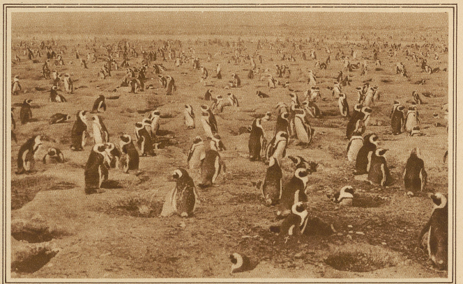
Ein unüberschaubares Heer von Pinguinen auf ihrem Brutplatz

Um 7 Uhr 25, 46 Stunden und 20 Minuten, nachdem wir in Kings Bay aufgestiegen waren, flogen wir wieder über Land, und das Polarmeer war zum erstenmal überflogen worden.