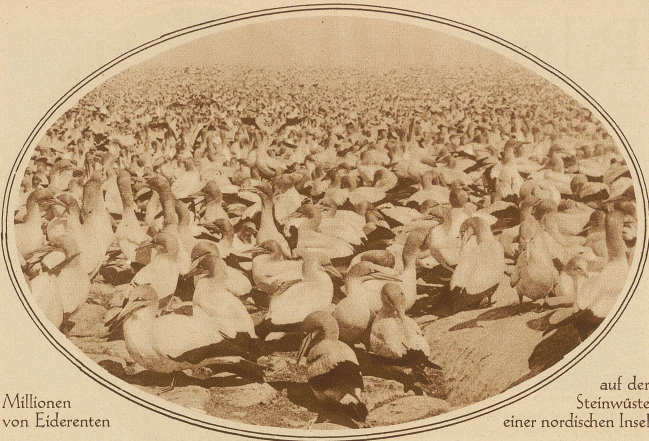
Millionen von Eiderenten