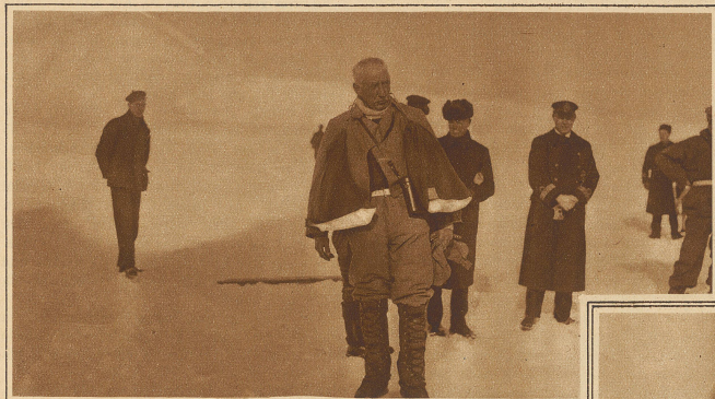
Roald Amundsen geht an Bord

wisse Aengstlichkeit verraten. Wir waren nicht besorgt. Wir hatten nur ein Gefühl der Erlösung, eine unaussprechliche Freude, daß wir endlich fortgekommen waren.