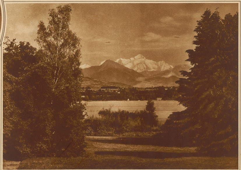
Ausblick vom Park der Villa Bartholoni auf See und Mont Blanc

schon das Baugelände selbst, das nach seiner natürlichen Lage und seiner Geschichte europäische Bedeutung besitzt. Für einen Palast, in dem die glücklichere Zukunft der Menschheit ihren Ausdruck finden soll, ließe sich kein idealerer Platz finden, als diese einzigartige Ecke des Genfersees. Der Parkcharakter, den die Grundstücke des künf-