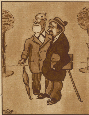
«Schen Sie mal, da geht der Leichtgewichtsmeister aus unserer Straße.» «Nana, ein Boxer!» «Nec — unser Fleischermeister.»

Angerannt. Ueber den Kasernenplatz in Zürich schreitet ein Soldat der Küchenmannschaft mit einem vollen Kessel. Ein Hauptmann, der des Weges kommt, stellt ihn, zieht einen Löffel aus der Tasche und kostet die Brühe im Kessel. «Pfiu Teufel, das soll Suppe sein, es schmeckt ja wie Abwaschwasser», donnert der Offizier den Mann an. Dieser fährt in Positur und meldet: «Es isch Abwaschwasser, i wottis dört däm Bur i si Bütti schütte, er gits de Säul!»