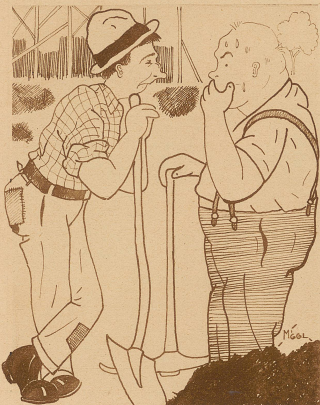
Er weiß sich zu helfen!

A.: «Je n'iz ni no wonder, wohi mer die große Hüfe Dreck wönd tue!» B.: «Mi grad au, ... aber halt, j' chünnt mer öppis in Sinn ... Det i de sebe Wiese unde chönnnt mer e großes Loch ufgrabe und alli die Hüfe det ab keiel!»