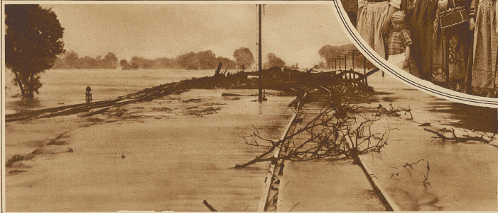
Zerstörter Bahnkörper bei Rollingsfork