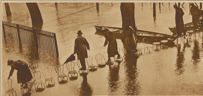
Noch läßt sich auf diese Weise ein Uebergang ermöglichen, aber stündlich steigt das Wasser

Die ersten Bilder der furchterlichen Ueberschwemmungskatastrophe im Mississippigebiet, in welchem jetzt umfangreiche Dammsprengungen zum Schutze der Stadt New-Orleans vorgenommen werden müßten, beweisen schon den Ernst der Situation. Ueber 100 000 Menschen sind obdachlos geworden und gegen 200 in den Fluten ungerettet