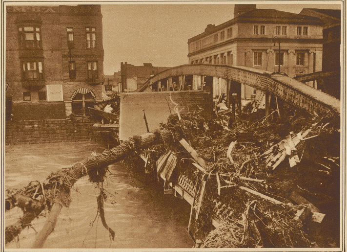
Angeschwemmte Zeugen der verheerenden Wirkungen der Fluten bei der Ortschaft Rollingsfork