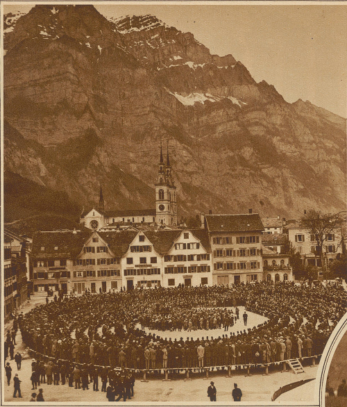
Glarner Landsgemeinde auf dem Marktplatz Im Hintergrund der Wiggis