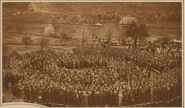
Die entscheidende Wahl um den Ständeratssessel an der Urner Landsgemeinde in Böstingen-Schattdorf