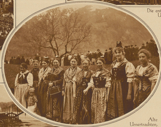
Alte Urnertrachten, die jeweilen aus Anlaß der Landsgemeinde getragen werden