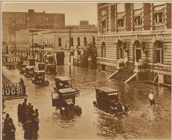
Ueberschwemmte Straße in Little Rock