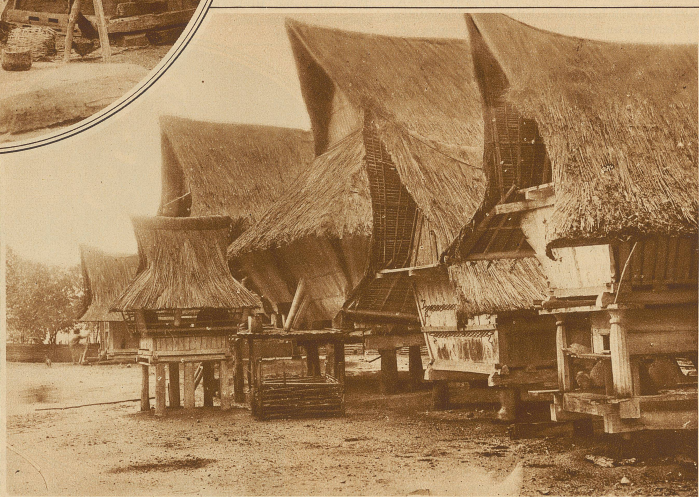
Karo-Batakhäuser im Sibulangeit.

Kehrichts und der Abfälle dient. Zu diesem Zweck ist der Fußboden zu beiden Seiten nach der Mitte geneigt, während in der Rinne selbst ein nur 30 cm breites Brett als Laufplanke mit so breiten beiderseitigen Fugen liegt, daß aller Unrat sofort durchfallen kann. / Ein aufrechtes Gehen, ohne sich den Kopf an einem der Querbalken zu stoßen, ist unmöglich. Zu beiden Seiten befinden sich unmittelbar auf dem Boden je 1-3 Feuerstellen, die durch eine bloße Erd- oder Lehm-schicht gebildet und mit einem Holzrahmen eingefast sind. / Nur reiche Häuptlinge bewohnen mit ihrer Familie ein Haus allein, das dann auch nur eine Feuerstelle hat. Nachts werden die Nischen, wie bereits gesagt, meist durch Herablassen von Matten getrennt, so daß sie einzelnen Zimmern gleichen. Für den Abzug des Rauches ist in keiner Weise gesorgt. Niemand scheint bisher auf die Idee gekommen zu sein, im Dach irgendeinen Abzug zu schaffen. / Sehr interessant sind die Schnitzereien und Malereien an den Häusern. Während man bei den meisten sogenannten Naturvölkern eine ausgesprochene Vorliebe für figurliche Darstellungen antrifft, finden wir hier auch eine überraschende Fülle der schönsten Ornamente mit teils geometrischen und pflanzlichen Motiven. So besetzen wir dem