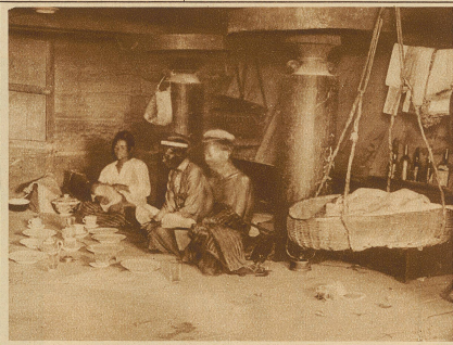
Im Innern eines Batakhauses.

ten hergestellte und den einzelnen Familien als Schlafstelle dienende Nischen. Von der Tür läuft gerade zur entgegengesetzten Seite eine 50 cm breite und 30 cm tiefe Rinne, die gleichsam einen Gang bildet und außerdem zur Aufnahme des