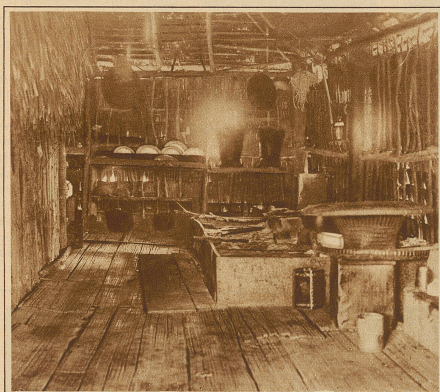
Blick in eine Batak-Küche auf Sumatra.

Die Kunstfertigkeit der Batak-schen Schnitzkunst können wir vor allem an den sehr wirkungsvoll zur Geltung kommenden, an den Häusern angebrachten Verzierungen bewundern. Oftmals unter-