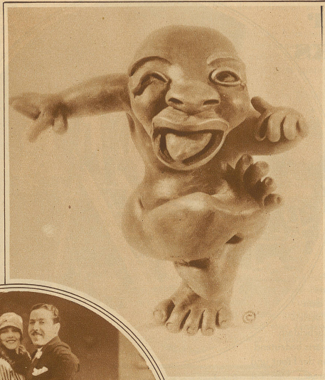
Der heilige Jazz. «Jazzo» ist eine eigenartige Skulptur, die auf der letzten Ausstellung der unabhängigen Künstler in New York großes Aufsehen erregte. Der Ausdruck des Götzgen ist wahrlich nicht schlecht getroffen

Zu diesen schon länger bekannten, aber immer mehr ausgebauten Methoden hat sich nun in den letzten Jahren die Blutforschung gesellt. Sie hat ihren Ursprung in der 1901 gemachten Entdeckung des preussischen Stabsarztes Uhlenhuth. Er fand, daß Serum von einem auf bestimmte Art vorbehandelten Tier die roten Blutkörperchen von einem Exemplar der gleichen Tiergattung zur