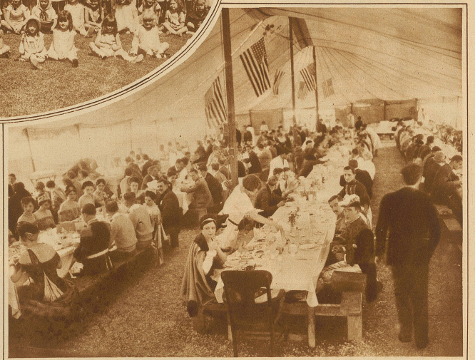
Teilansicht der Filmstadt Hollywood

Aufgeführt wurde in Naila in Oberfranken das schöne Stück «Das Nuller!». Ich bekam eine sehr schöne Rolle, das Gigerl, einen Gecken. Ich, fünfzehn Jahre alt, mit einer enormen Künstlerkrawatte, einen knallroten Schopf am Kopf oben, und auch sonst keine vollkommene Schönheit, ich also — und ein Geck.