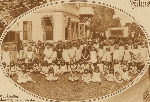
60 zukünftige Filmstars, die sich für den Film «Onkel Toms Hütte» meldeten. Von diesen kleinen Künstlerinnen beziehen einige heute schon größere Gehälter als unsere Bundesräte