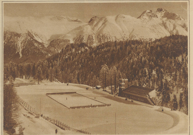
Das neue Eisstadion in St. Moritz, der Schauplatz der Eisläufer-Konkurrenzen der olympischen Winterspiele