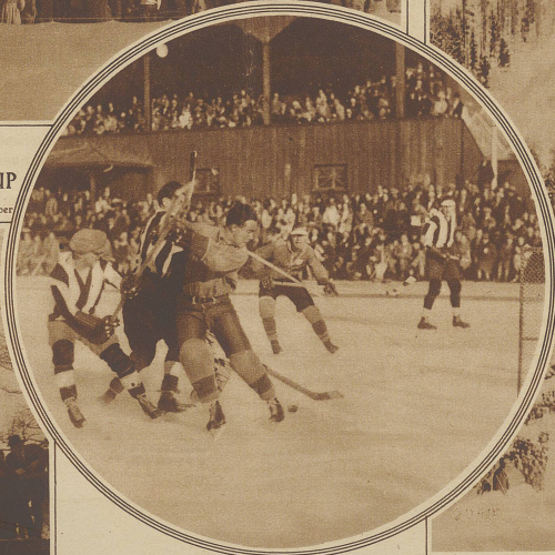
Im Kampf um den Puck