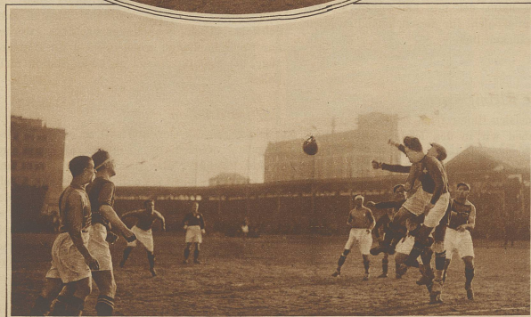
Kopfballszene vor dem Tor der Schweizer