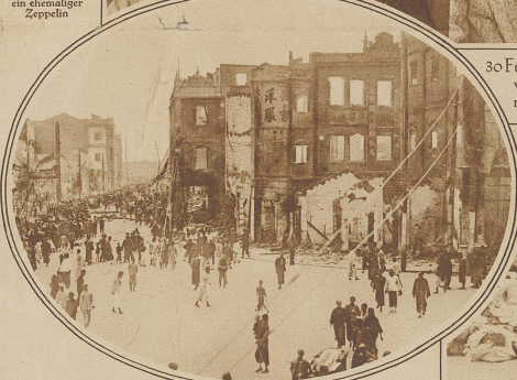
Eine Feuersbrunst zerstörte ein großes Geschäftsviertel. Der Gebäudeschaden allein wird auf über 50 Millionen Franken geschätzt