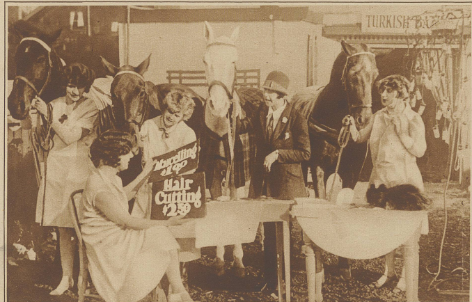
Haarschneiden und Dauerwellen für Pferde. In Amerika sind sogar die Pferde eitel. Es ist deshalb ein Salon eingerichtet worden, wo ihnen auf Wunsch der Besitzerin Dauerwellen gebrannt werden. Anschließend an den Friseursalon befindet sich ein türkisches Bad