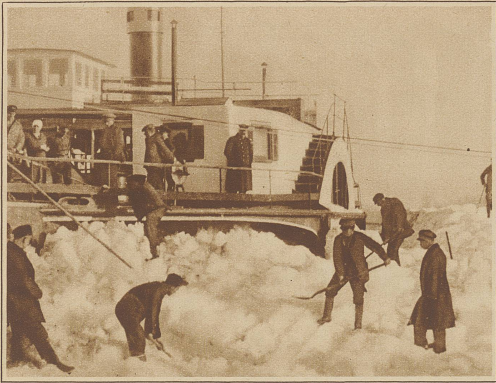
Die Donau ist auf einer Länge von etwa 18 km mit meterhohem Eis bedeckt. Alle Versuche, die ungeheure Eisbarriere durch Sprengungen zu lockern und so Lieberschwimmungen zu verhüten, blieben erfolglos. Der ungarische Dampfer "Sazava" liegt im Eise eingeschlossen. Das Bild zeigt die vergeblichen Versuche, ihn wieder flottzumachen