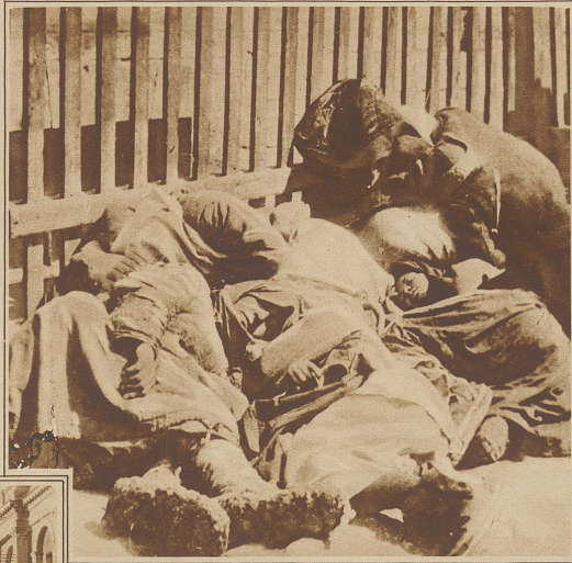
Aus dem täglichen Leben Sowjetrußlands. Durchreisende kampieren neben einem Bahnhof