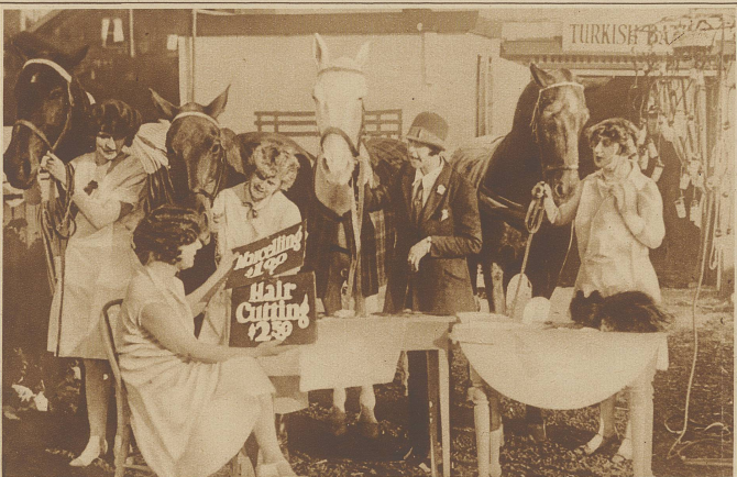
Haarschneiden und Dauerwellen für Pferde. In Amerika sind sogar die Pferde eitel. Es ist deshalb ein Salon eingerichtet worden, wo ihnen auf Wunsch der Besitzerin Dauerwellen gebrannt werden. Anschließend an den Friseursalon befindet sich ein türkisches Bad