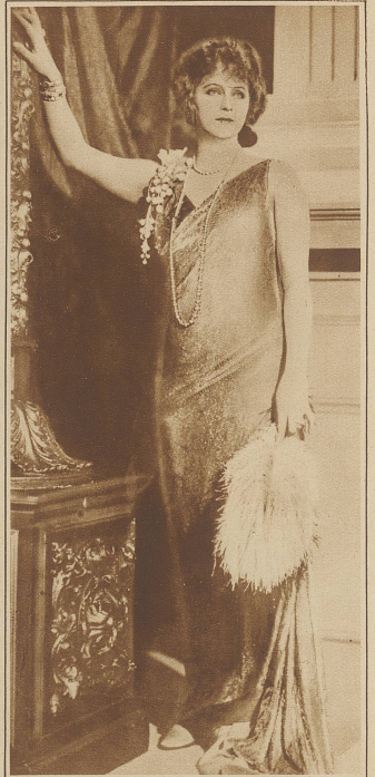
Bild rechts: Claude France, Frankreichs schönste und erfolgreichste Filmschauspielerinnen, ist freiwillig aus dem Leben geschieden. Wie uns versichert wird, soll Claude France aus dem Kt. Bern gebürtig gewesen sein