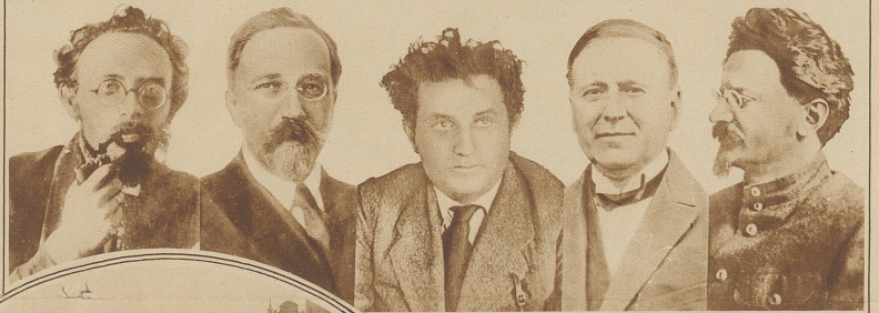
30 Führer der Opposition sind von der Sowjetregierung nach Sibirien verbannt worden, darunter die bekanntesten: (Von links nach rechts) Kadek, Kamenew, Sinowiew, Rakowsky und Trotzky

Alle, was fliegen konnte, wurde in Bewegung gesetzt, um dem Empfang am Bahnhof die richtige triumphale Aufmärsch zu geben. Lächer der Stadt schwebt die ehemalige Zeppelin