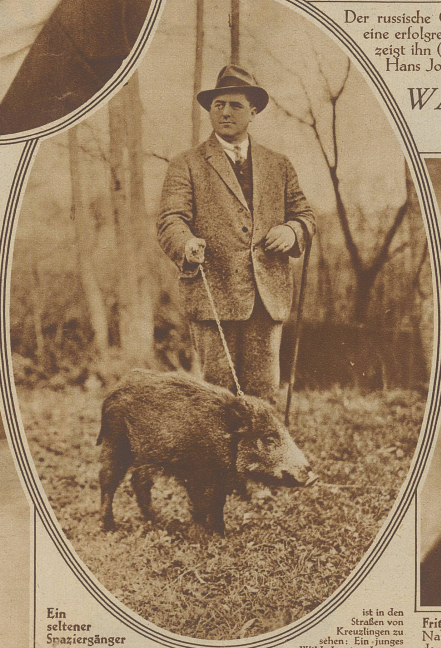
Ein seltener Spaziergänger

etwa 7 Wochen gefangen und mit der Milchflasche aufgezogen wurde. Das Tier scheint mit dem neuen Leben sehr zufrieden zu sein und verschlingt kleine ihm gebotene Leckerbissen mit freudigem Grollen