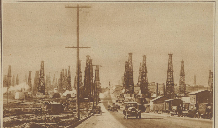
Ein Wald der Technik. Blick auf ein Feld von Petroleum-Bohrtürmen in der Nähe von Los Angeles