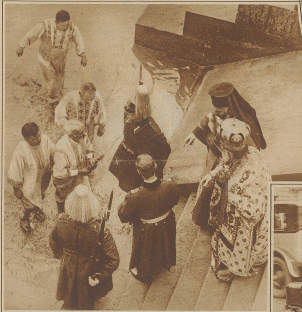
In Rumänien wird nach altem Brauch alljährlich das Fest der Wasserweihe feierlich begangen. Das Bild zeigt, wie ein Kreuz, das die Wasserweihe empfangen hat, dem Prinzen Nicholas (in Uniform ohne Mütze) überreicht wird. Hinter dem Prinzen der Patriarch von Rumänien, Miron Christea