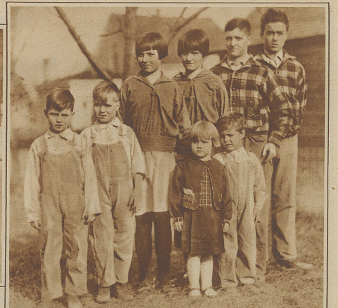
Ein Zwillingquartett. Die Familie Koger in Omaha, Nebraska, ist mit 4 Zwillingpaaren gesegnet und hat außerdem noch 4 weitere Kinder. Das Bild zeigt die Stufenleiter der Zwillinge