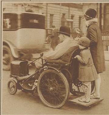
Ein neuer Krankensstuhl mit elektr. Antrieb. Auf diese Weise ist es dem im Bilde ersichtlichen engl. Parlamentsmitglied Major Cobham möglich, mühelos zu den Sitzungen zu fahren. Hinten auf der Plattform stehen als Passagiere seine beiden Kinder