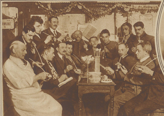
Ein eigenartiger Wettbewerb wurde in Brüssel durchgeführt. Sieger wurde derjenige, welcher an einer mit 3 Gramm Tabak gefüllten Pfeife am längsten rauchte, ohne daß das Feuer ausging. Der Sieger brachte es auf 1 Stunde 8 Minuten