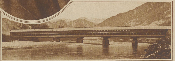
Die abzubrechende Brücke Ragaz-Maienfeld ist von den Schweiz. Bundesbahnen der liechtenstein. Gemeinde Russell zur Verfügung gestellt worden und wird nun zwischen Russell-Salez-Sennwald wieder aufgebaut