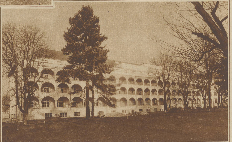
Blick auf das soeben eröffnete neue St. Klara-Spital im Hirzbrunnen-Park in Basel, das von den Ingenbohrer Schwestern geführt wird