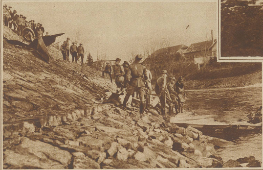
Pilot und Motor stürzten über die Böschung hinunter ins Wasser