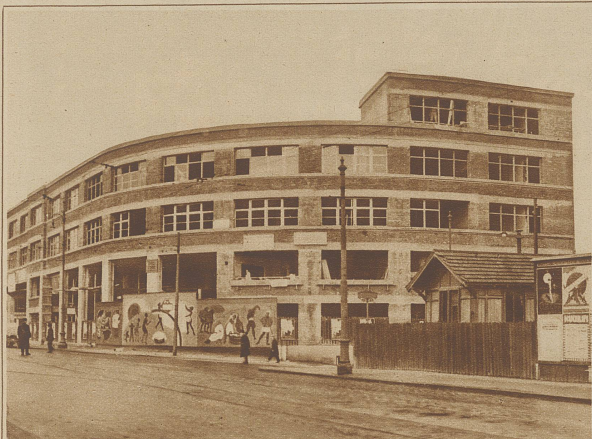
Mit der Fertigstellung der Großgarage Schlotterbeck besitzt die Stadt Basel die größte Autogarage der Schweiz. Bemerkenswert ist, daß die Wagen über eine Rampe bequem in die obere Stockwerke geführt werden können