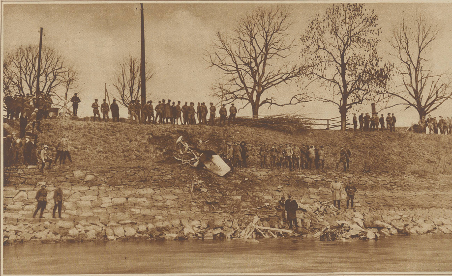
Die Unglücksstelle bei Schwäbis