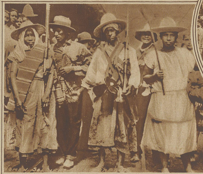
Bewaffnete Frauentruppe der Freiheitskämpfer Nicaraguas