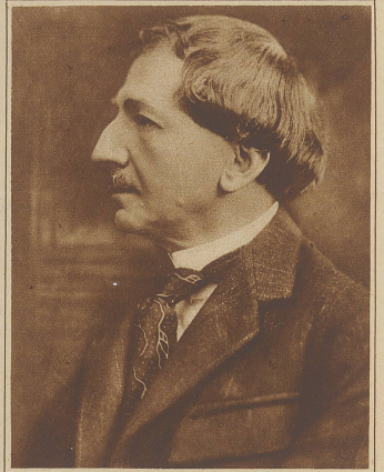
Grafin Du Juvare, den Leibarzt des verstorbenen Königs von Rumänien, ist die schwere Anklage erhoben worden, daß er durch gewissenlose Behandlung und mangelndes ärztliches Können das Leben des Königs um mehrere Jahre gekürzt habe. Persönliche Interessen sollen dabei eine Rolle gespielt haben