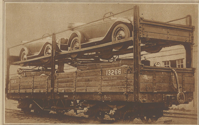
Zweistöckige Güterwagen sind auf den südafrikanischen Bahnliniten mit Erfolg ausprobiert und eingeführt worden

Rebellen Nicaraguas übergaben ihre Gewehre den Marinesoldaten der Vereinigten Staaten