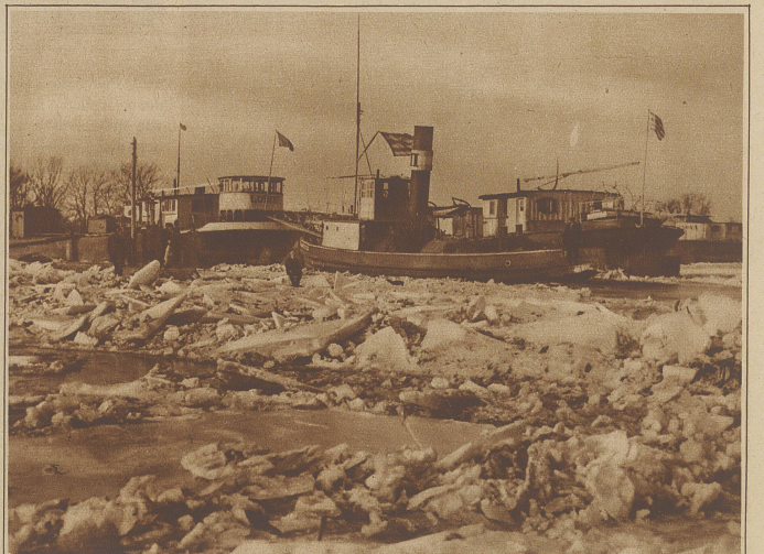
Der Eisgang der Donau im Hafen von Giurgin (Rumänien)