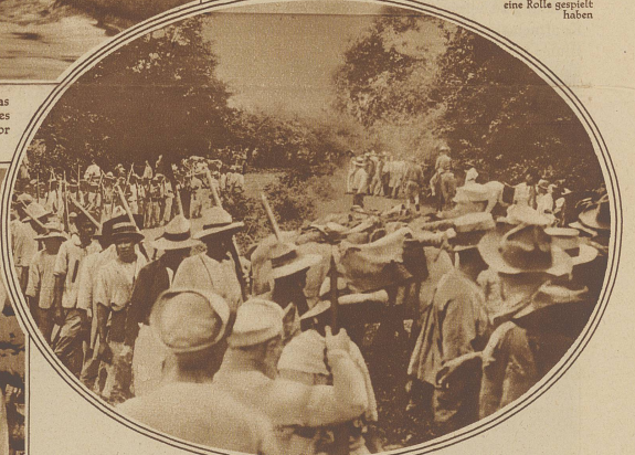
Zum Abschluß des Aufstandes in Nicaragua

Rebellen Nicaraguas übergaben ihre Gewehre den Marinesoldaten der Vereinigten Staaten