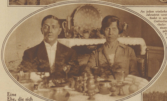
An jedem wiederkehrenden Todestag des vor Jahresfrist verstorbenen Kaisers von Japan findet in seinem ehemaligen Palast ein Götterdienst statt, zu welchem seine «Seele» aus der Paulowihalle auf einem einfachen Karren herbeigeholt wird. Voran schreiten Träger mit dem Altar, der mit einem weißen Tuch bedeckt ist