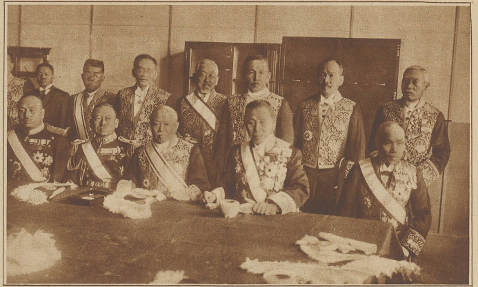
Zur Auflösung des japanischen Parlaments. Unser Bild zeigt den japanischen Ministerrat, der seinen Sturz nur durch das vom Kaiser erzwungene Auflösungsdekret vermeiden konnte. Als zweiter von rechts sitzt Ministerpräsident Tanaka