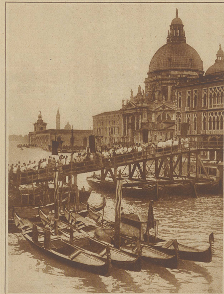
Malerische Prozession der Bevölkerung Venedigs zur Kirche Madonna della Salute über eine besonders für dieses Kirchenfest errichtete Brücke

Prinzessin Viktoria, die Schwester des deutschen Exkaisers, die vor wenigen Monaten den 30 Jahre jüngern Russen Alexander Zubkoff heiratete, hat ihren Gatten in eine Irrenanstalt sperren lassen