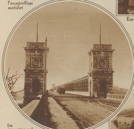
Ein eigenartiges und trauriges Jubiläum

Kann die Reichsbrücke in Wien beglücken. Eine Statistik der Wiener Polizei hat festgestellt, daß sich kürzlich der tausendste Selbstmörder von ihrem Geländer in die Fluten der Donau gestürzt hat. Die Wiener Polizei, die gegen diese Verliebe der Selbstmörder machtlos ist, will jetzt auf dem Geländer eine elektrische Leitschiene anbringen lassen, die jeder berühren muß, der sich darüber in das Wasser stürzen will. Der Strom wird so reguliert, daß er erschreckt, aber nicht tödtet