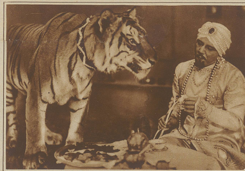
Ein unheimlicher Tischgast. Der Sensationsfilmdarsteller Harry Piel mit seinem liebtingtiger Baylard