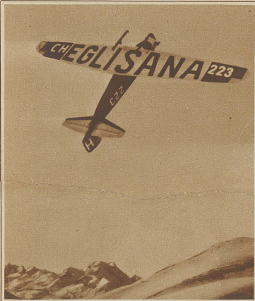
Das mit Riesenschrift versehen Reklameflugzeug, das bis zum Schluß der Olympiade täglich mit Start auf dem St. Moritzersee Passagierflüge ausführt