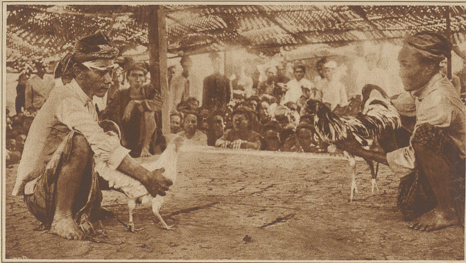
Der Beginn eines Hahnenkampfes. Man beachte die langen Kampfsporen

«Da ist nichts dabei,» meinte Kristian, «ich kann heute nacht dort hinaufklettern, denn ich kenne ja den Weg und bin oft oben gewesen, um die Scheiben zu putzen. Ich brauche nur das oberste Ventil zu öffnen, dann kann ich die Rolle und die Schnur an dem Haken dort befestigen, den sie im Karneval dazu benützten, um daran Dekorationen aufzuhängen.»