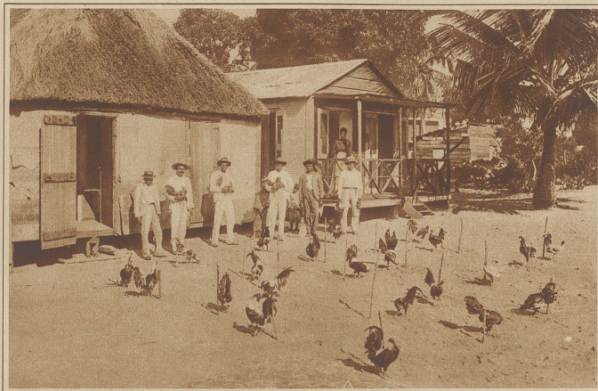
An Pfählen angepflochte Kampfhähne

Der Kampfhahn spielt bei den Eingeborenen der Philippinen eine ganz besonders große Rolle, gilt es doch als eine der größten Ehren, den besten Kampfhahn zu besitzen. Abgesehen davon ist aber auch das Geschäft sehr einträglich, da bei den Hahnenkämpfen immer große Wetten abgeschlossen werden, die viel Geld einbringen können, und das ist nach Ansicht der dortigen Bewohner schließlich die Hauptsache. Die Kampfhähne werden meistens bedeutend besser behandelt als die Frauen. Geht der Herr aus, so nimmt er den Hahn mit, um irgendwo an einer Straßenecke einen Kampf zu improvisieren