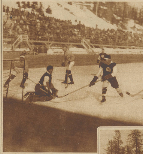
Eine kritische Situation vor dem Tor der Oesterreicher