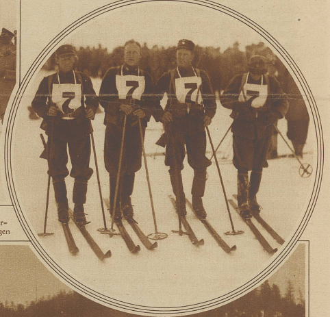
Im Kreis: Die siegreiche Militärpatrouille von Norwegen