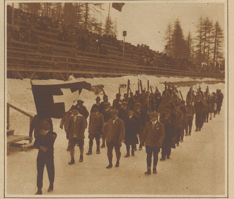
Die schweizerische Delegation marschiert zum Defilee

Nachdem Oesterreich gegen Deutschland auch nur ein unentschiedenes Resultat von 0:0 erzielt hat, dürfte die Schweiz Aussicht haben in die Schlusspiele zu kommen