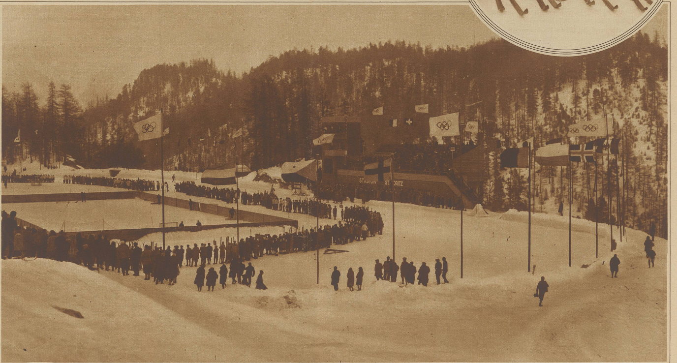
Blick auf das Eisstadion während der Eröffnungsfeier. Die Wettkämpfer machen in einem großen Halbkreis Front gegen die Haupttribüne, die im Bilde nicht mehr sichtbar ist