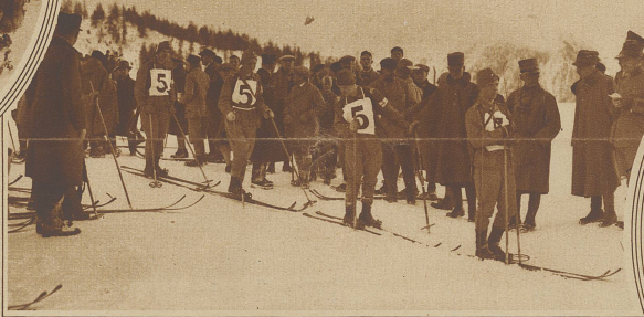
Die Militärpatrouille Finnlands, die sich mit 3 Std. 54 Min., 37 Sekunden als Zweite hinter Norwegen klassierte und mit 27 Sekunden Vorsprung die Schweiz um diesen Rang brachte