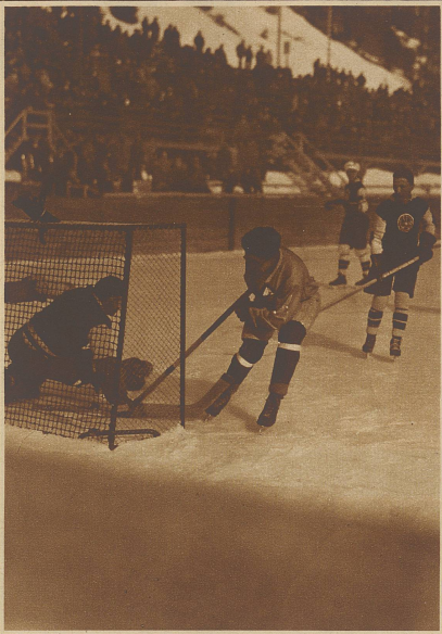
Die Schweiz erzielt das ausgleichende vierte Tor