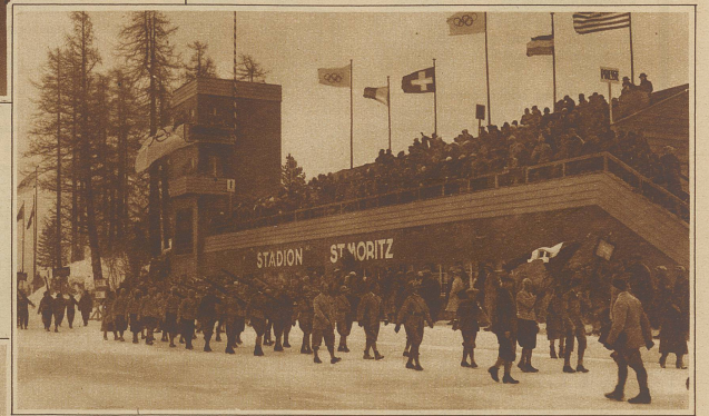
Aus dem Vorübermarsch der Nationen, anlässlich der Eröffnungsfeier. Im Vordergrund Italien