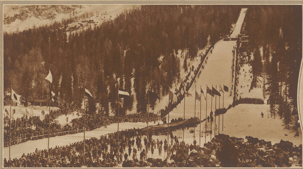
Die Olympia-Schanze während des großen Sprunglaufes, dem gegen 10,000 Zuschauer beiwohnten

Im Oval: Thullin Thams, der olympische Sprunglaufsieger des Jahres 1924, erreichte in St. Moritz die Rekord-Sprunglänge von 73 m, stürzte jedoch beim Niedersprung