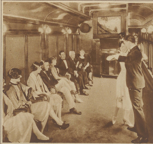
Tanz nach den Klängen des Lautsprechers

nium-Diner» zu bestellen. Wie eine New-Yorker Berichterstatlerin verrät, betreiben einige Firmen, die moderne Aluminium-Kochgeräte auf den Markt bringen, in vielen größeren Städten der Vereinigten Staaten eine merkwürdige Reklame. Die Hausfrau wendet sich einfach an die Aluminiumgesellschaft, gibt den Tag an, an dem sie das Diner wünscht und teilt mit, wieviel Personen anwesend sein werden. Zur festgesetzten Stunde erscheint ein Vertreter der Gesellschaft mit seinen Gehilfen, bringt alles zum Bereiten des Menüs Notwendige mit und kocht in der Wohnung ein schmackhaftes Essen. Wenn die Hausfrau nicht genug Porzellan, Silber oder Tischwäsche hat, dann hilft die Gesellschaft aus. Die Zubereitung erfolgt natürlich in den Kochgeräten, die vorgeführt werden sollen. Vor dem Essen versammelt sich die Gesellschaft in der Küche und bewundert die glänzenden Pfannen, Kessel, Töpfe und Kannen, die Röst- und Grill-Apparate, die auf dem Herde aufgestellt sind und in denen die einladenden Speisen kochen. Der Vertreter erklärt den Zweck und die Handhabung der einzelnen Apparate und zeigt den Gästen die Speisen. Sein kleiner Vortrag ist natürlich ein Hymnus auf den praktischen u. hygienischen Segen der Aluminium-Kochgeräte. Er selbst u. seine Ge-