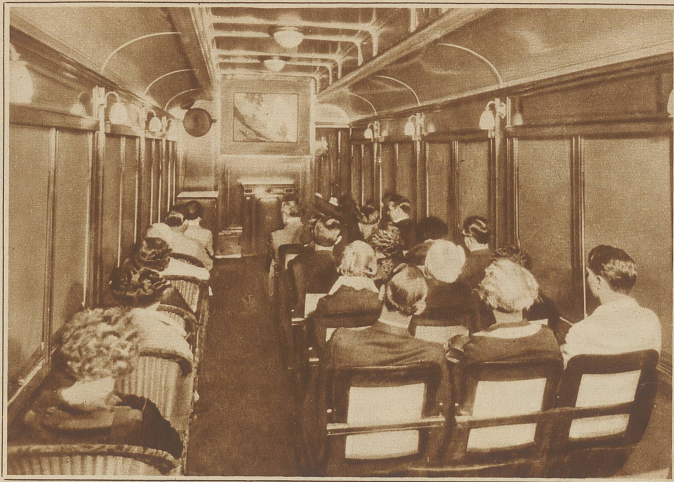
Blick in den Kinowagen

das Herz zusammenpreßte, erkannten sie in dem Tumult ihrer Gefühle das Schmerzlichschte, das Klarste, das Unerträglichste von allem: ein unendliches Mitleid mit dem stöhnenden Mann, der auf allen Vieren unter dem Tische herumkroch und nicht emporkommen wollte.