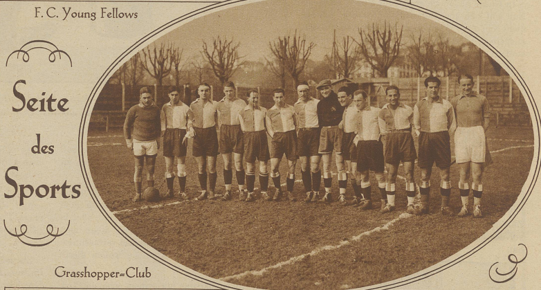
F. C. Young Fellows