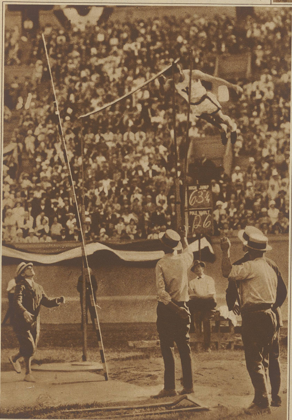
Neuer Stabhochsprung-Weltrekord. Der ausgezeichnete amerikanische Stabhochspringer Carr verbesserte in New York den Weltrekord auf die labelhafte Höhe von 4,29 Meter. Carr beim Niedersprung