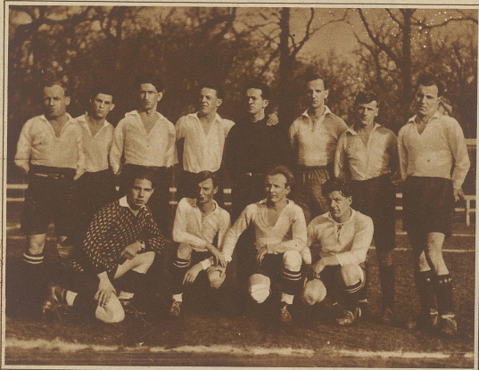
F. C. La Chaux-de-Fonds