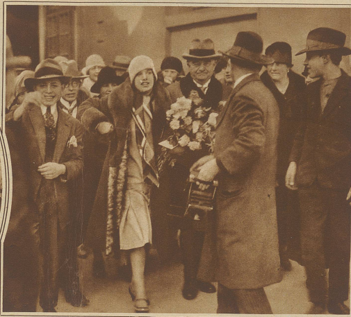
Die bekannte Filmschauspielerin Lily Damita wurde bei ihrer Ankunft in Bern stürmisch begrüßt

in einer angemessenen Form zugänglich gemacht werden soll, hat sich ein bernisches Komitee gebildet. Die Auktion zur Erhaltung des Schlosses verdient weiteste Unterstützung der Öffentlichkeit