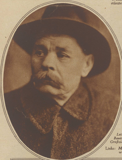
Links: Maxim Gorki, der bekannte russische Schriftsteller, wird diesen Monat 60 Jahre alt

Unten (im Kreis) Einige der verunglücktesten Tierleichen