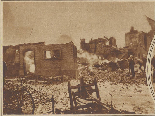
Blick auf die Brandruinen

Letzte Woche brannte in Russikon (Zürich) der große Bauernhof von alt Kantonsrat Schellenberg nieder. 14 Stück Großvieh blieben in den Flammen