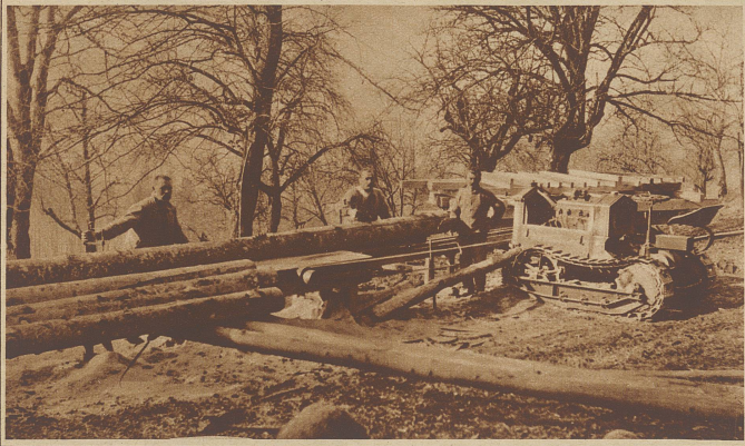
Der Traktor als Fräsmaschine; eine Erfindung, die es auch kleineren landwirtschaftl. Betrieben ermöglicht, den Traktor vor allem im Winter besser auszunützen