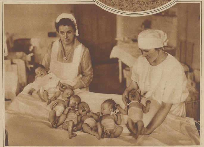
Sie werden nur alle vier Jahre Geburtstag haben. Eine Gruppe junger Erdenbürger, die am 29. Februar in einer Frauenklinik das Licht der Welt erblickten