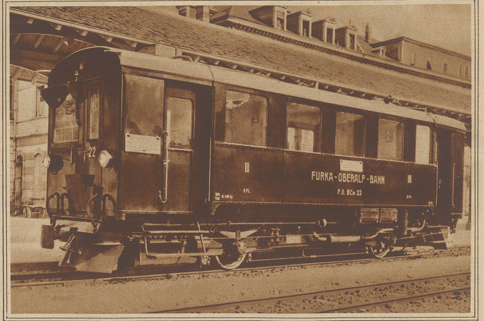
Die Furka-Oberalp-Bahn hat zwei neue von Winterthur gelieferte Benzin-Motorwagen in Dienst genommen, die hauptsächlich während der Zeit verminderter Verkehrsfrequenz vorzügliche Dienste leisten. Der Benzinverbrauch beträgt nur etwa 1/2 Liter pro km