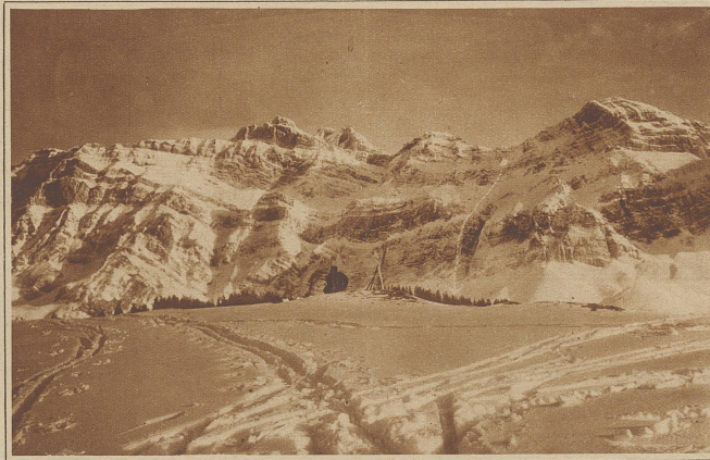
Ueberblick über den Absturz. Der Pfeil zeigt die Absturzhöhe von etwa 500 Metern

alt Kreisinstruktor der 4. Division, ist nach kurzer Krankheit in Aarau gestorben. Oberst Hintermann gehörte seit 1875 dem Instruktionkorps unserer Armee an und erwarb sich auch große Verdienste um die Organisation und den Ausbau des turnerischen und militärischen Vorunterrichtes