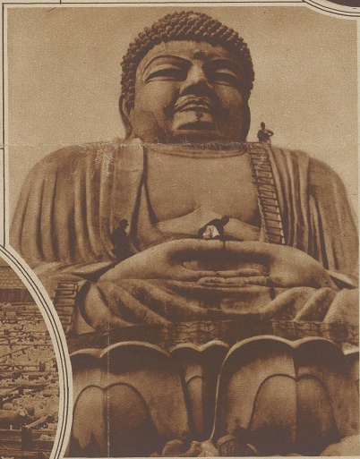
Die größte Buddhastatue der Welt wurde kürzlich in Beppu (Japan) errichtet. Sie ist gegen 30 Meter hoch. Als Maßstab für die Größenverhältnisse dienen am besten die winzigen Figuren der Arbeiter, die auf der Statue herumklettern.