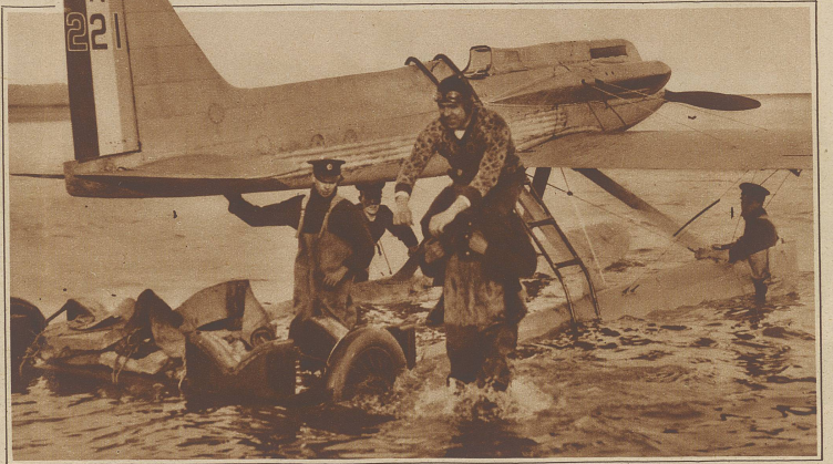
Der bekannte englische Flieger Kinkead stürzte beim Versuch, den Geschwindigkeits-Weltrekord zu schlagen, ins Meer und ertrank. Schon am Samstag zwang ihn ein Körpergefühl zu einer Notlandung, die, wie unser Bild zeigt, glücklich verlief. Beim nächsten Versuch am Montag erreichte ihn das Schicksal.