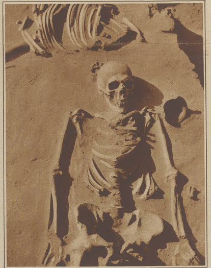
Der Mensch der Urzeit. Bei den Arbeiten am Dnjepr-Kraftwerk wurden wichtige archaische Ausgrabungen gemacht. So fand man u. a. ein vollständig erhaltenes Menschenskelett, das neben einem Pferd begraben war und vermutlich einige Tausend Jahre alt ist. Auffallend sind die unverhältnismäßig langen Arme.