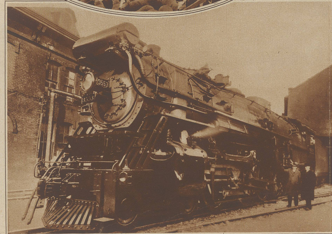
Eine neue Riesenlokomotive ist in Amerika gebaut worden. Sie wiegt voll geladen 350 Tonnen und ist imstande, Züge von 100 Wagen zu schleppen