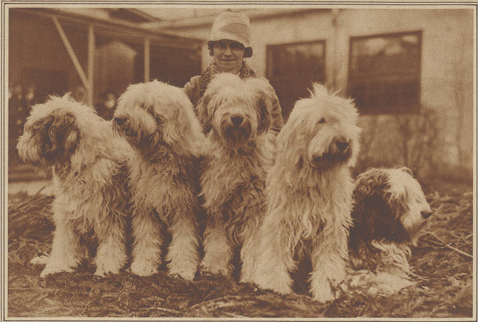
EINE GRUPPE PRÄCHTIGER ENGLISCHER SCHÄFERHUNDE