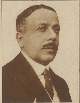
Dr. Octavio Mangabeira Brasilens Außenminister

die Spielkarten in Frankreich bereits im Anfang des 14. Jahrhunderts kannte. Das Kartenspiel erreute sich am französischen Hofe sehr bald großer Beliebtheit und fand unter allen Ständen weiteste Verbreitung. In einer alten Oper «Karl VI.» wird diese Tradition dramatisch wirksam benutzt. Ein berühmter Kartenmaler jener Zeit war Jaquemin Gringonneur. Auf der National-Bibliothek in Paris befinden sich sieben Stück von der Hand Gringonneurs gemalte Karten, welche wahrscheinlich zu einem größeren Spiele gehörten. Sie haben mit den heutigen weder in bezug auf die Größe, noch Figuren und Farben Ähnlichkeit. Diese Karten enthalten kleine Gemälde; dargestellt sind der Papst, der Kaiser, der Eremit, die Sonne, der