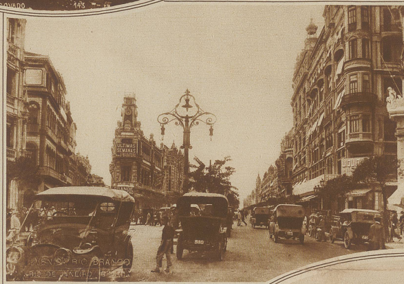
Das Leben auf der Avenida Rio Branco, einer Hauptstraße Rio de Janeiros

me der tropischen Sonne. Die Reichheit des Landes gibt allen die Lebensmöglichkeit ohne allzu anstrengende Arbeit. Nur deshalb kann hier auch der Schönheitssinn so sehr entwickelt sein. Man hat Zeit, sich an den Reizen der