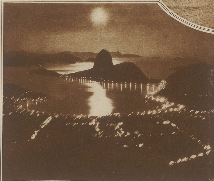
Nachtstimmung über der Hauptstadt Brasiliens. In der Mitte des Bildes der «Zuckerstock», das Wahrzeichen Rio de Janeiros

Natur zu erfreuen, die Schönheit der hübsch gekleideten Frauen zu bewundern und alltäglich spielt sich so eine zwanglose Parade der Mode und der Gesellschaft ab, wenn am Spätmittage die Damen in kleinen Gruppen durch die Avenida promenieren zwischen den spalierbildenden Herren hindurch. / Fast noch schöner als am Tage ist Rio de Janeiro bei Nacht, wenn das milde Dunkel alle Gegensätze verhüllt und ein Lichtermeer von unbeschreiblicher Farbigkeit aufleuchtet, sich ins Meer ergießt und im Spiel der Wellen wieder erlischt. Ueberall Licht: groß und durchdringend die weiten Straßenzüge entlang, auf den vielen Hügeln und besonders auf dem Zuckerhut, der die Gegend beherrscht und auf den eine Schwebebahn führt, kleiner, aber flimmernd, wie lichtbestrahlte Edelsteine, sickert es aus den Häusern in die samtne Weichheit der Nacht. / Von der Höhe besehen glaubt der Beschauer ein Märchen zu erleben und es fällt ihm nicht leicht sich vorzustellen, daß da unten jetzt Menschen in Kinos sitzen, in den Hotels zu rassisger Jazzmusik tanzen, im Theater europäische Künstler bestaunen und sich selbst in reichsten Toiletten bewundern lassen oder in ihren Klubs am Spieltisch stehen und leidenschaftlich die Launen des Glücks verfolgen.