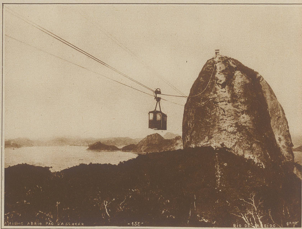
Die Seilbahn auf den «Zuckerstock»