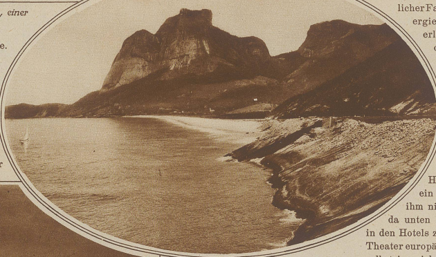
Malerisches Strandbild, aus der Umgebung von Rio de Janeiro