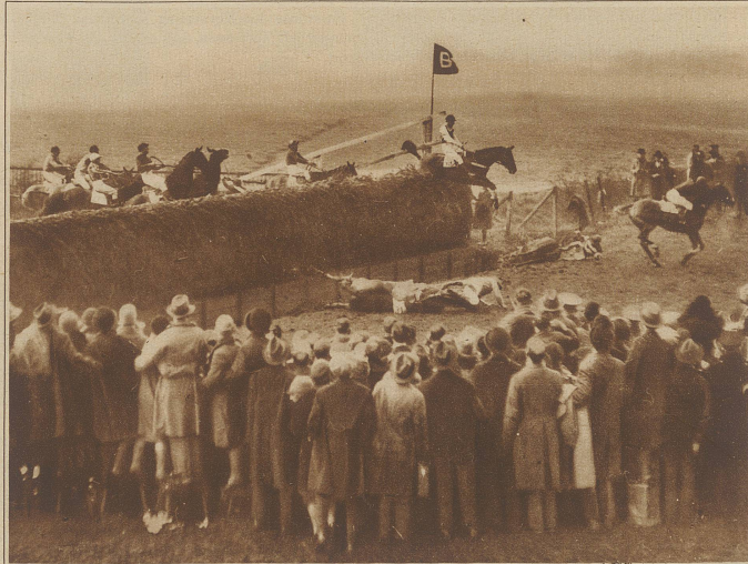
Das größte und schwierigste Pferderennen der Welt ist das alljährlich in Liverpool zum Austrag kommende GRAND NATIONAL, das am Freitag eine Besetzung von 42 Pferden aufwies, von welchen aber nur zwei ins Ziel einliefen; alle übrigen stürzten. Unser Bild zeigt zwei gefährliche Stürze an einer der ersten Hürden