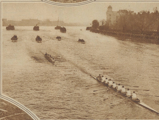
Das 80. Wettrennen zwischen den Universitäten Oxford und Cambridge wurde letzten Samstag von Cambridge mit 10 Längen gewonnen. Oxford hat zum 40. und Cambridge 29 Siege zu verzeichnen; ein Kampf blieb unentschieden. Das Bild zeigt den Stand des 7. km langen Rennens bei der Hammersmith-Brücke; Cambridge führt mit 2 1/2 Längen