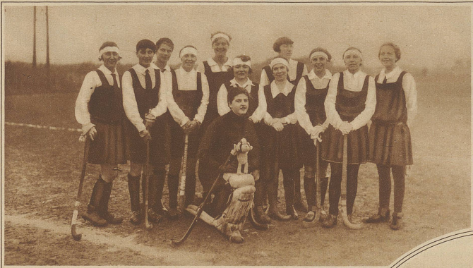
Red Sox' Damen gewannen im Final gegen Champel die schweizerische Damen Hockey-Meisterschaft