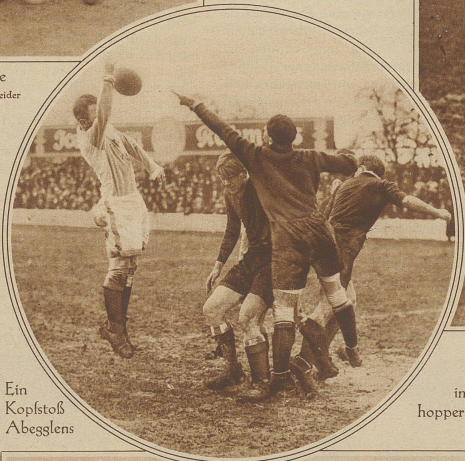
Ein Kopfstöß Abeggrens