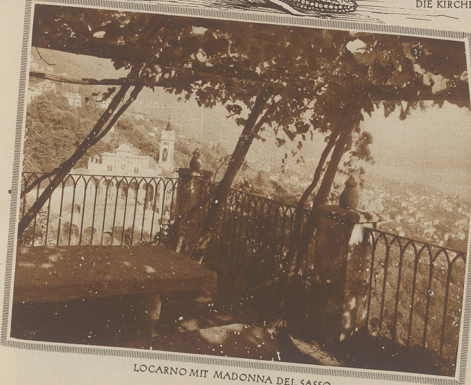
LOCARNO MIT MADONNA DEL SASSO