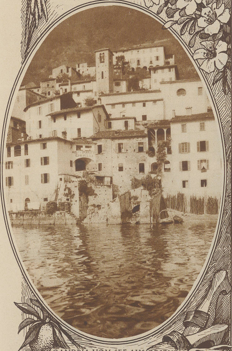
GANDRIA VOM SEE AUS GESEHEN