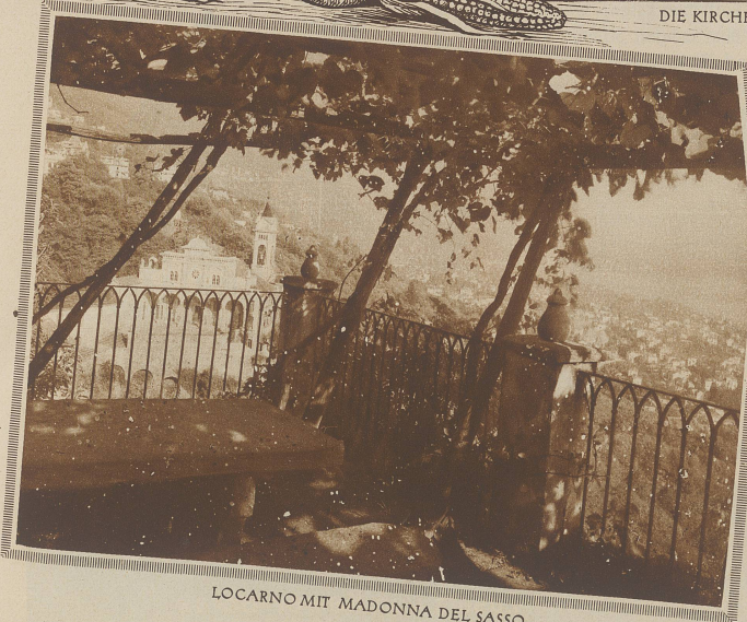
LOCARNO MIT MADONNA DEL SASSO