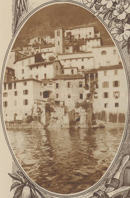
GANDRIA VOM SEE AUS GESEHEN