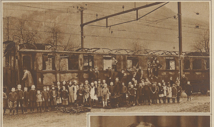
Vorige Woche geriet bei der Durchfahrt auf der Station Flums ein österreichischer Wagen I. und II. Klasse des Schnellzuges Paris-Wien in Brand. Die Fahrgäste konnten sich rechtzeitig in Sicherheit bringen, dagegen blieb der größte Teil des Handgepächs in den Flammen.