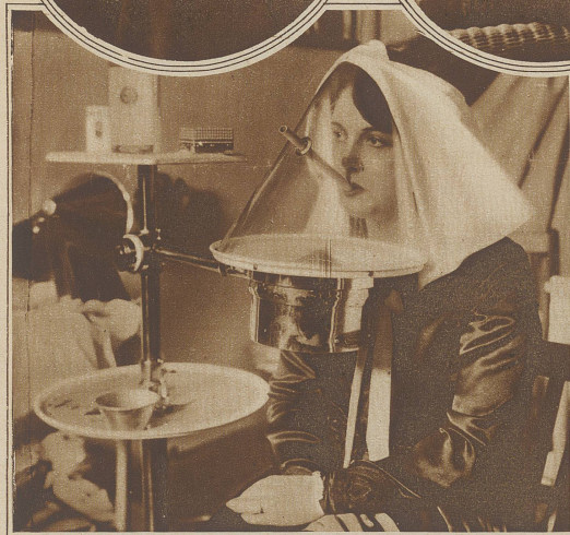
Das Dampfbad als Schönheitsmittel. Ein amerikanischer Erfinder hat einen Apparat konstruiert, der zur Erhaltung eines frischen und reinen Teints dienen soll. Es handelt sich um ein Dampfbad, bei dem das Gesicht vollständig abgeschlossen ist; die Luft wird durch ein schmales Rohr durch den Mund zugeführt

Links (im Oval): Der PAPST nimmt lebhaften Anteil an Nobiles Polflug und hat als Expeditionsteilnehmer Pater Gianfranceschi (Porträt) bestimmt General NOBILE mit seiner «Mascotte Titina» vor der Abreise in Mailand