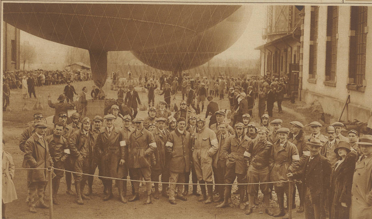
Die Teilnehmer der Fuchsjagd