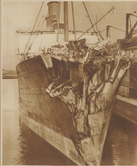
Ein Dampfer rammt einen Eisberg. Der 16000-Tonnen-Dampfer «Montrose» lief dieser Tage mit vollstündig eingedrücktem Bug, der dem zerbeulten Balg einer Ziehharmonika glich, in Liverpool ein. Das Schiff hatte einen Zusammenstoß mit einem Eisberg gelitten. Passagiere und Besatzung können nicht genug die Kaskadentätigkeit des Kapitäns Loney rühmen, der sie ihre Rettung aus höchster Gefahr zu danken haben. Das Schiff hatte im dichten Nebel plötzlich einen Eisberg gesichtet. Dem Kapitän gelang es, dem Ungetüm auszuweichen, da aber gleichzeitig ein zweiter, kleinerer Eisberg auftauchte, sah er sich gezwungen, zwischen zwei Liebsten das kleinere zu wählen und beschloß daher, mit Vollkraft gegen den kleinen Eisberg anzurennen. Durch den Anprall wurden alle 472 Passagiere des Schiffes zu Boden geworfen. Zwei Matrosen wurden getötet. Der Zusammenstoß war furchtbar; er glich dem Donner eines Kanonenschusses und ein Berg von Eis und Schnee stürzte auf das Schiff.