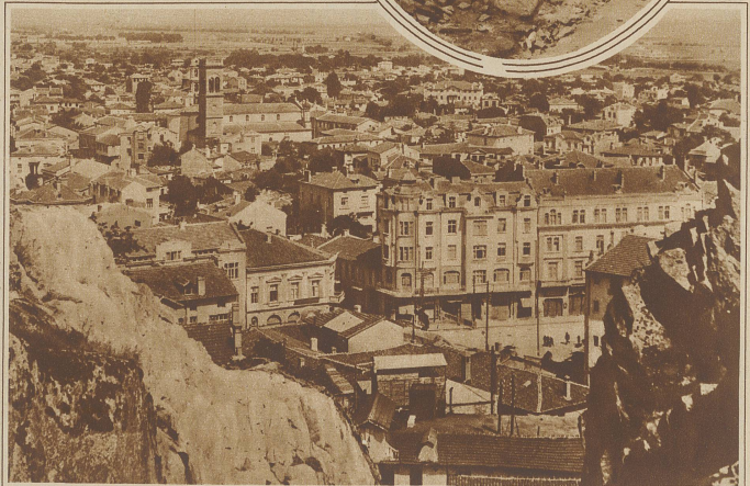
Die Erdbebenkatastrophe in Bulgarien. Letzten Samstag wurde Südbulgarien, speziell das Mariabatal, von einem furchtbaren Erdbeben heimgesucht. In den Städten Philippopol und Tschirpan ist kein Haus zu finden, das nicht mindestens durch Risse und Dach einstürze gelitten hat. Glücklicherweise gingen dem heftigen Beben leichtere Stöße voraus, so daß sich die meisten Menschen in Sicherheit bringen konnten. Trotzdem hat Tschirpan 25 Tote zu beklagen