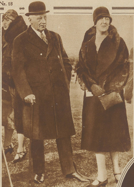
Der spanische Diktator Primo de Rivera mit seiner 46jähr. Braut Mimí Castellano, die ein jährliches Einkommen von 500000 Franken hat