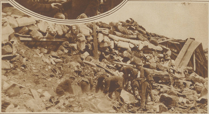
Der Trümmerhaufen der Volksbank in Tschirpan