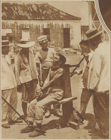
Grausame Hinrichtungsmethode auf den Philippinen. Erdrosseln eines zum Tode Verurteilten in Manila. Und solche Schandtaten duldet man noch in Protektionsgebieten sogenannter Kultur-nationen