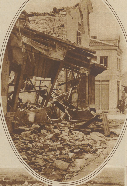
nach der Katastrophe