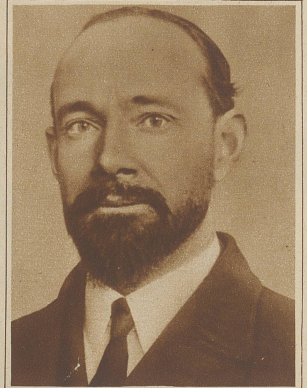
Den Nordpol überflogen. Nach Byrd und Nobile-Amundsen ist es nun auch den australischen Flieger Wilkins gelungen, den Nordpol zu überfliegen. Er startete in Cap Barrow (Alaska) und landete nach 27 1/2 stündigen Flug über den Pol in Green Harbour auf Spitzbergen. Porträt: Wilkins

Sturm auf dem Ozean. Das Bild, das an Bord des englischen Dampfers «Snapdragon» im Golf von Biscaya aufgenommen wurde, gibt einen Begriff von den ungeheuren Wasserbergen, die bei stürmischer See entstehen können