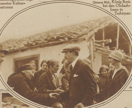
Unteres Bild: König Boris bei den Obdachlosen in Tschirpan