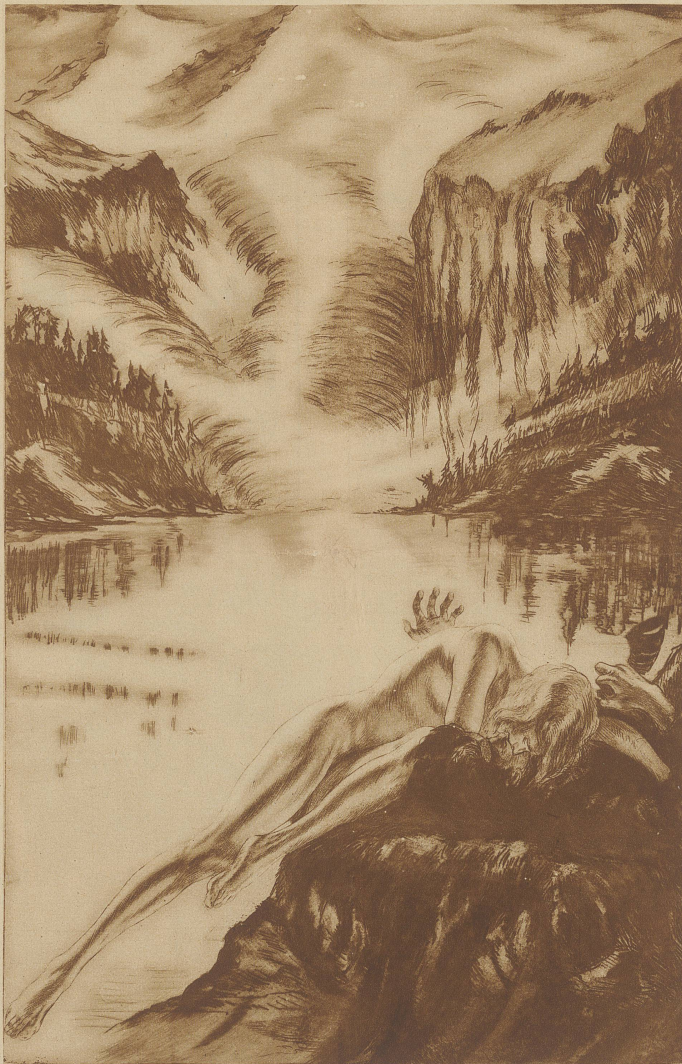
Originalradierung von Alois Kolb

«Welcher Sorte?» fragte der Präsident schnell.