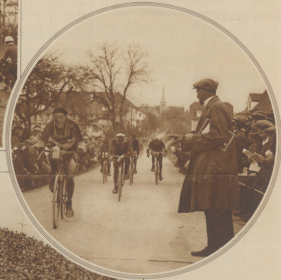
Zentralschweizerische Rundfahrt in Bremgarten Ankunft der Junioren