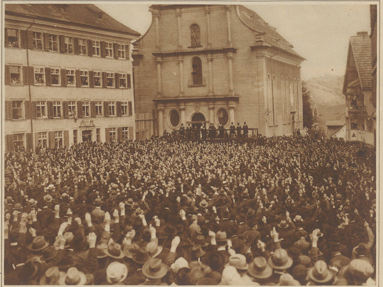
Die Wahl des Landammanns