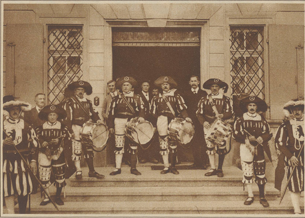
In historische Uniformen gekleidete Trommler rufen die Bürger zur Landsgemeinde