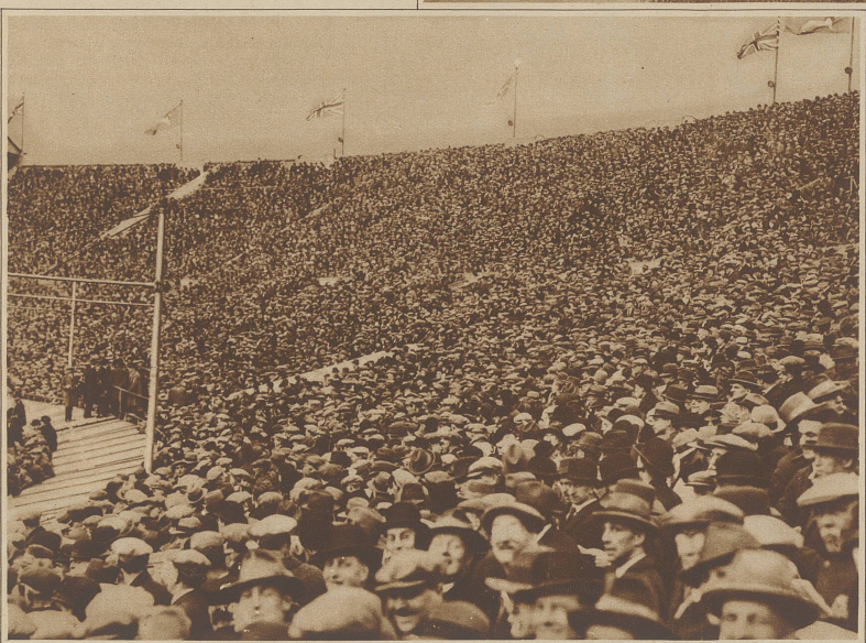
Blick auf die ungeheure Zuschauermenge, die dem Spiel mit Begeisterung folgte.