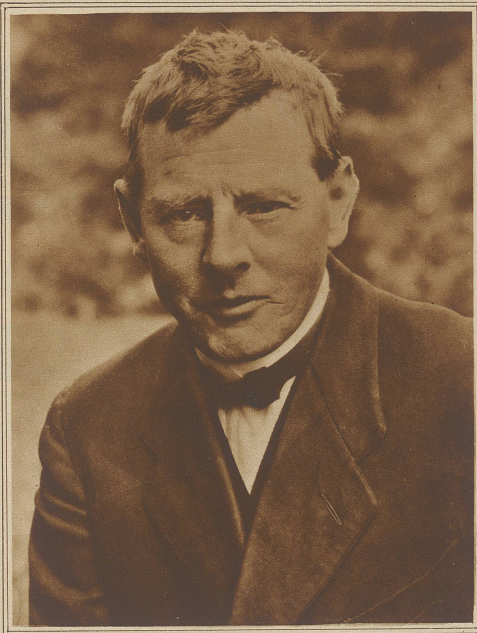
HEINRICH FEDERER, der berühmte Schweizer Schriftsteller, ist am vor- letzten Sonntag an den Folgen einer Blinddarm- entzündung im Alter von 61 Jahren in Zürich gestorben