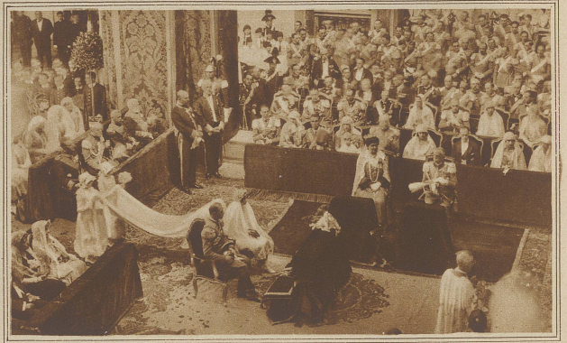
Hochzeit am italienischen Königshofe: Trauung des Prinzen Filibert mit der Prinzessin von Arenberg im Königspalast in Turin. Das Brautpaar sitzt in der Mitte, zur Seite der König und die Königin von Italien