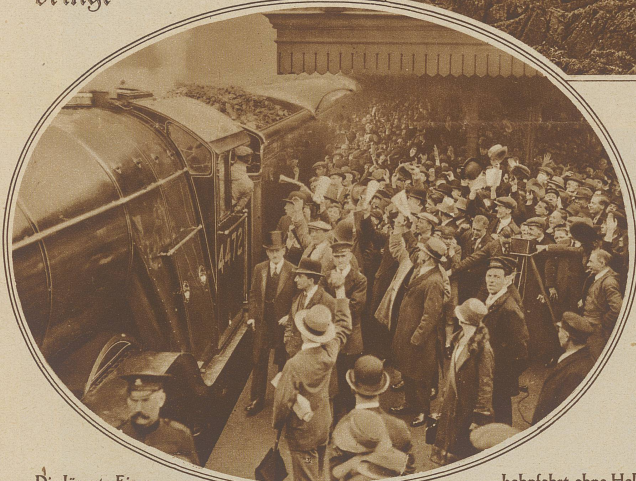
Die längste Eisen- bahnfahrt ohne Halt ist letzte Woche in den englischen Fahrplan aufgenommen worden. Es handelt sich um den «fliegenden Schott- länder» - so heißt der Expresszug - der die Strecke London-Edinburgh, die etwa 640 km mißt und damit ungefähr die doppelte Länge von Romshorn-Genf aufweist, ohne Zwischenhalt durchfährt. Wenn da Schnell- zugzuschläge erhoben werden, wird sich sicher niemand daran stoßen