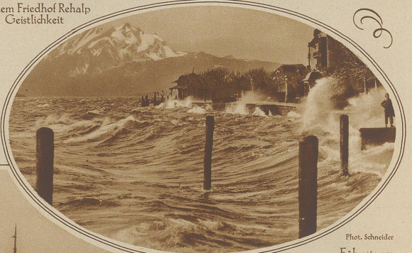
Föhnsturm auf dem Vierwaldstättersee bei Weggis

Unteres Bild: Der deutsche Dampfer «Präsident», der von Hamburg nach Mothil (Schottland) unterwegs war, wurde am Sonntag durch den Sturm auf die Klippen von Eyemouth geworfen und derart eingeklemmt, daß wenig Hoffnung be- steht, das Schiff wieder flottmachen zu können