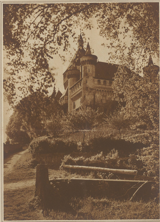
SCHLOSS VUFFLENS oberhalb Morges