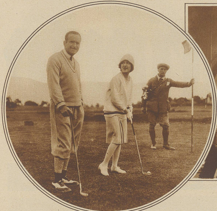
Douglas Fairbanks ist mit seiner Gemahlin Mary Pickford zum Kuraufenthalt in Genf eingetroffen. Das Bild zeigt die beiden beim Golfspiel.