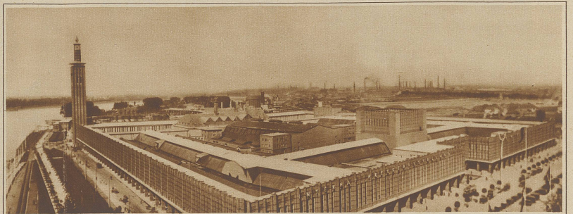
Gesamtansicht der großen Internationalen Presseausstellung in Köln, die am 10. Mai eröffnet wurde