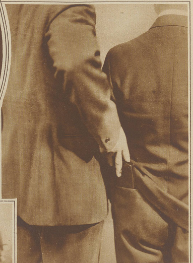
Wie's gemacht wird. Ein Taschendieb an der Arbeit