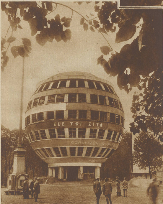
Das erste Kugelhaus der Welt geht in Dresden der Vollendung entgegen