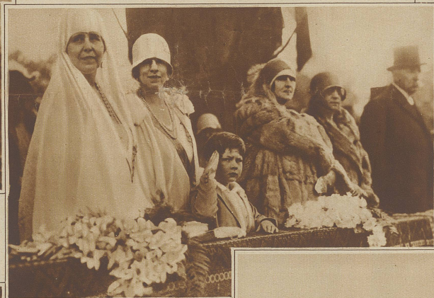
Aus Anlaß der rumänischen Unabhängigkeitsfeier fand in Bukarest erstmals eine große Truppenparade vor dem jungen König Michael statt. Das Bild zeigt ihn grüßend in Begleitung seiner Mutter, seiner Großmutter und der Exkönigin Elisabeth von Griechenland. Uns scheint allerdings, der Knabe zeige größeres Interesse für den Photographen als für die Soldaten